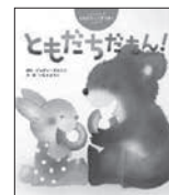
ともだちだもん! ジュディ・デルトン