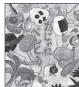
だじゃれべんとう 岡田 よしたか