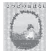
よつばのおはなし かとう まふみ