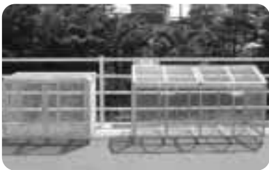
▲寄贈された2基のゴミ籠