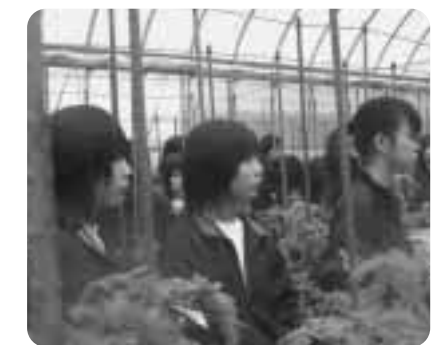
▲説明を真剣に聞く生徒

六戸わい化りんご村所有の田ん ぼに行われました。指導にあたっ たのは、農協及び改良普及センタ ーの職員約8名。天候はあいにくの 小雨模様、約10aの田んぼに苗を 植えていく子供たち、なれない作 業に悪戦苦闘しながらもぬかるむ 泥の感触に終始笑顔で田植えを楽 しんでいました。収穫後にはとれ たての米を学校に送ることとなっ