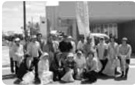
▲清掃活動に参加した皆さんです。