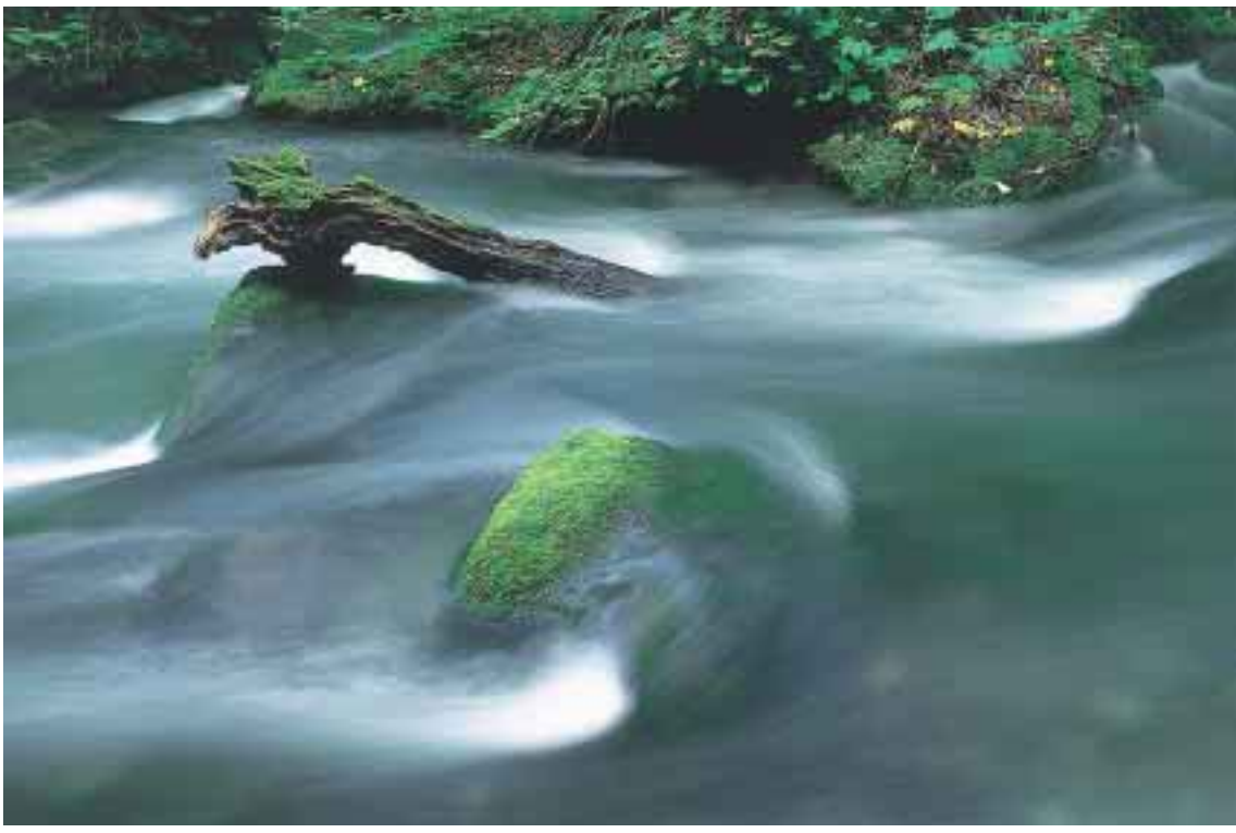
佳作 「流木の造形」