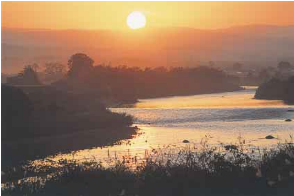
準特「夕景」