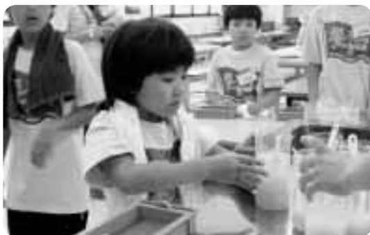
▲新聞でリサイクルはがきを作成

を着たり、「ミニ放水体験や救急法など、人命救助の大変さから「命の大切さ」を学びました。」また、昔を体験しよう!と手打ちそばはし竹とんぼ作りをしました。やはり、慣れないのか子供たちは悪戦苦闘の様子でした。また、郷土資料館や町の文化財などを見学。昔の人の生活風景などを調査。今の時代とはまったく違う道具や衣服など、不思議そうに見つめる子供たちがとても印象的でした。