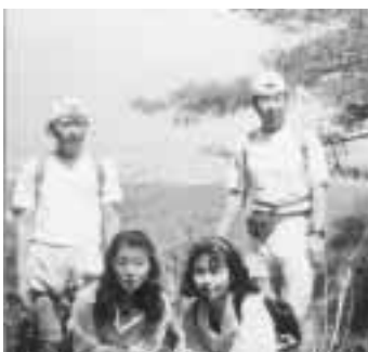
▲走る仲間と高尾山にて(右端:筆者)

住めば都といいますが、故郷六戸でも、ここ八千代市でも、その土地に長い間ずっと生活している。その良さを忘れてしまいがちになります。そんな時でも、ジョギングやウォーキングをする。見える風景がその土地の良さがしっかりと覚えられ、再認識できるのではないのでしょうか。海外でもこちらの景色に似ているところをよく見つけます。これも日頃、ウォーキングやジョギングで意識的に見ていけばこそでしょう。