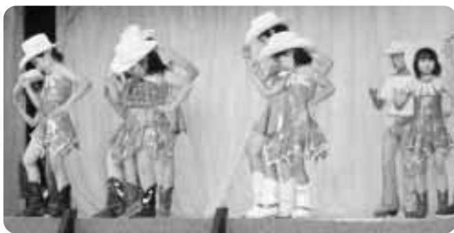
▲会場の目を引くチビッコダンサー

そしてなんと「言っても夏には「ビール」が欠かせないですよね! 商工会青年部で行っているビール天国は大盛況! この暑さで乾いた喉を潤しました。今年は天候にも恵まれ絶好の祭りの日和で訪れた人達は、夜遅くまで夏の宴を楽しみました。皆さん、来年もぜひいらしてくださいね。