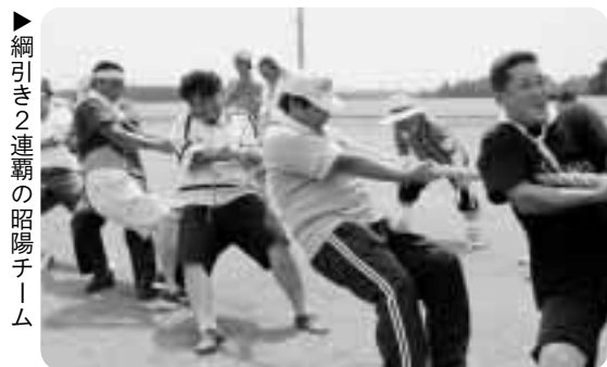
▶綱引き2連覇の昭陽チーム