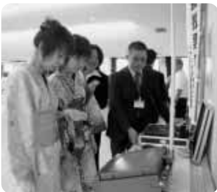
▶電子投票の体験をする新成人