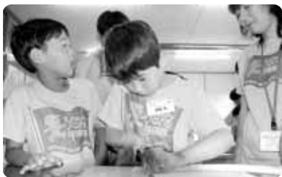
▲うまく切れるかな〜?

「もっと八戸町を知ろう!」とろくのへ探検隊が結成されました。隊員となったのは12名。8月6日結団式が行われ、隊員は元氣よく自己紹介をし、これからの4回の探検に期待を膨らましていました。八戸リサイクルプラザでは、リサイクルはどのように行われているかを学び、そして物への大切さを再認識。また、町の消防士さんはどんな仕事をしているのかを調査。車両の説明や実際の消防服