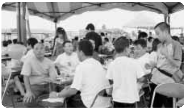
▲賑わいをみせる会場

会場では、アメリカンダンスやバンド演奏、風船早割り競走などのイベントが行われ、訪れた人たちの目を楽しませてくれました。