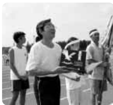
▲総合優勝の犬落瀬東チーム

今年の熱戦を制したのは「犬落瀬東チーム」昨年、惜しくも準優勝だった悔しさを晴らすかのよう