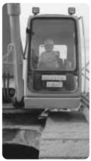
▲将来はこれで仕事だ!

通目木地区に建設中の「六戸調整池」で、10月4日と7日の2日間、見学会が行われ大曲小学校と開知小学校の5・6年生約60名が調整池が