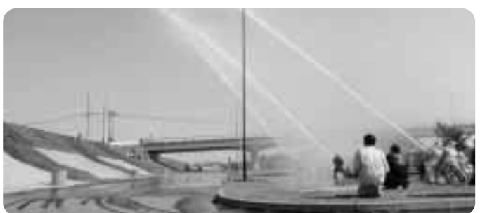
▲玉落し競技は放水技術の見せどころ

この日行われたのは消防車両での「中継、放水」の訓練。訓練とはいえ、団員の表情は真剣そのもの。実演後、消防署員より指導及び助言を受けました。訓練終了後は、各分団対抗の玉落し競技が行われ、放水の腕を競い合いました。結果は、次のとおりです。 ◇自動車ポンプの部 第1位 第8分団(米 沢) 第2位 第6分団(七 百) 第3位 第2分団(上吉田) ◇小型ポンプの部 第1位 第6分団(七 百) 第2位 第3分団(折茂新田)