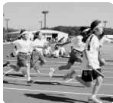
▲バトンリレーも必死!