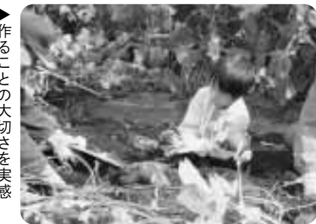
▶作ることの大切さを実感