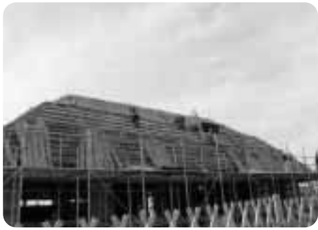
▲茅葺屋根工事のようす

町の文化財に指定されている旧 「芭米地家住宅」。その移築工事が今 年6月から始まりました。移築先 はメイプルふれあいセンター隣地。 老朽化が進んだことから平成13年 に解体し保管されていましたが、 昔の文化を後世に残そうと復元工 事が開始されました。その移築工 事の一つとして茅葺屋根の工事が 9月より始まっております。見学会が 10月1日に行われ、六戸小学校4・ 5年生約100名、一般の方20名 が参加しました。