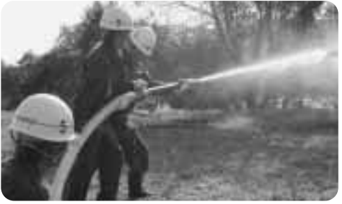
▲放水訓練中の消防団員

10月17日、むつみ河川敷公園にて、消火活動の一連の動作習得と知識向上のため六戸町消防団消防訓練が行われました。