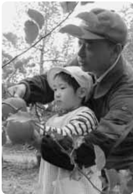
▲うまくとれるかな…?

その後、とれたてのりんごを口いっぱいほおばり、満足な笑顔ばかりがあらわれました。同園では低農薬、有機栽培のつがる「玉林」「紅玉」「ぶで」「シヨ