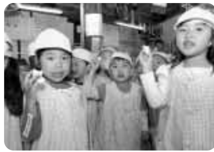
▲りんご片手にニコリ!!

ナゴールド」「北斗」「陸奥」の7品種を栽培。11月中旬までのりんご狩りが楽しめます。