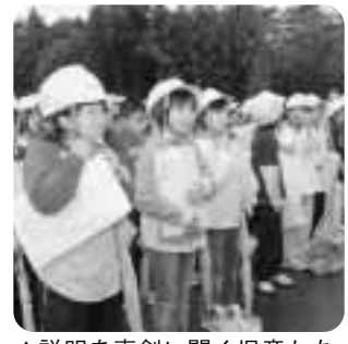
▲説明を真剣に聞く児童たち