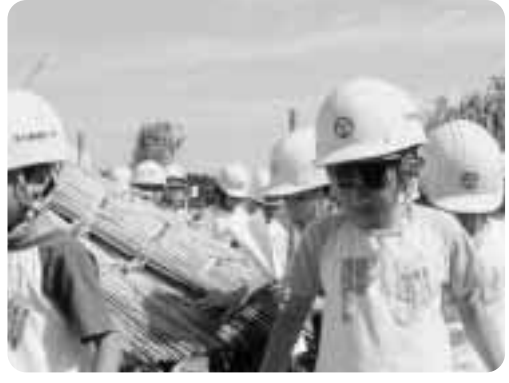
▶小学生もカヤに興味深々

今では見られなくなつた茅葺屋根、説明を受けながらめつたに見られない作業や道具を間近で見ると子供達の目ほども興味深げ。初めて茅に触れ「思ったより硬かった」「何で雨漏りしないのか不思議な話」って話していました。復元工事後は民族関係の資料を展示するなどして一般に公開の予定です。