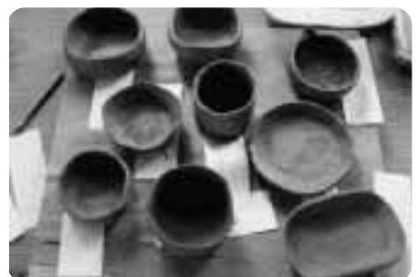
▶参加者の作品（作成途中）

参加者は慣れない手付きで悪戦苦闘の様子。それでも自分のオリジナルが出来るとあって、納得のいくものが出来たようです。形が出来上がり次回からは「施釉（釉塗り）」、「窯詰（焼作業）」を経て完成に至ります。