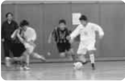
▶熱いプレーを見せる選手