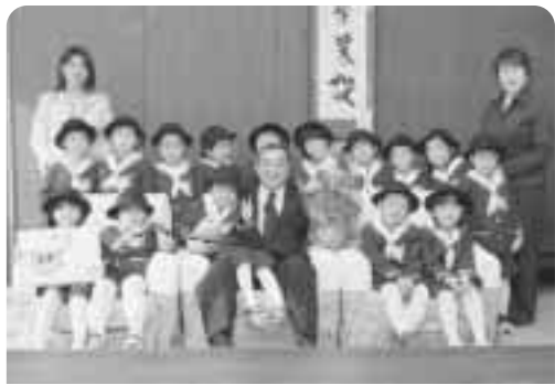
▲みんなニコリ！町長さんと一緒に写真撮影

吉田町長は、「みんなの気持ちを大切にこれからも皆さんのためにがんばっていきます」と園児達にお礼の言葉を述べました。