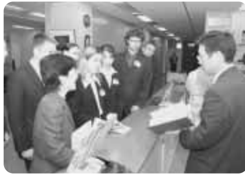
▲職場（町役場）の様子を見学

また、ちよと開催期間中だったメイプルタウンフェスタ2004にてたくさんさんのイベントを楽しみました。