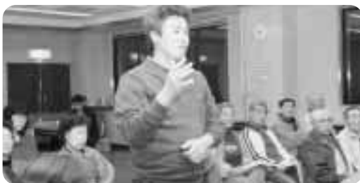
▶地域のために積極的に意見・要望をする参加者

11月29日、役場別館会議室にて「警察と六戸町住民による懇談会」が開催され、町交通安全協会、町防犯協会、各町内会長など約50名が参加。十和田警察署からは最近の犯罪状況や多発している「振り込め」や「架空請求」などの対処の仕方など説明。