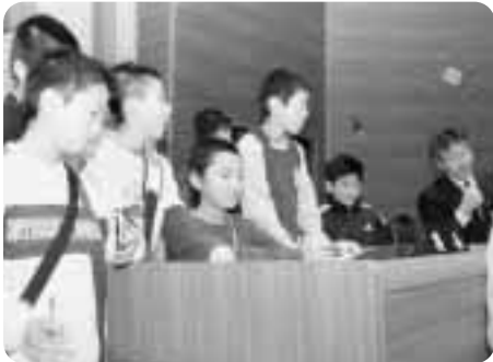
▲議長席に集まる児童

大曲小学校6年生の児童30名が12月6日、役場議場の見学をしました。役場の1階2階とは雰囲気が違う3階、まずは赤いじゅうたんに子供達はちよと緊張さみ。でも、議場に入ったとたん、議員席などに興味津々の様子。議場の説明する職員の話に真剣に耳を傾けていました。