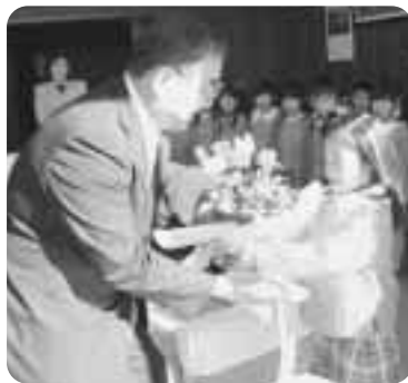
▲お花を手渡す園児（第一日の出）