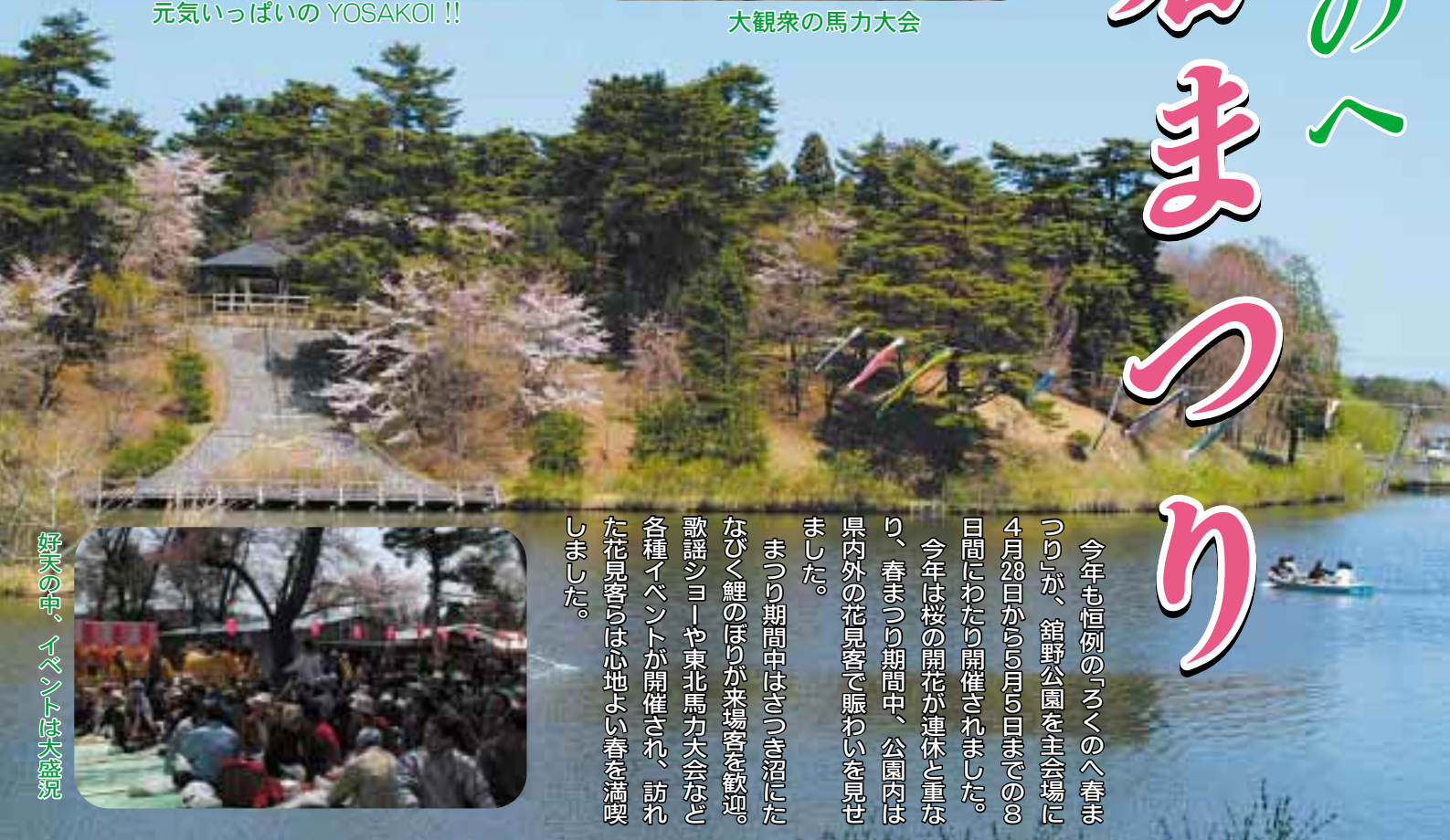
好天の中、イベントは大盛況