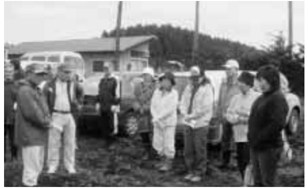
▲営農指導を受ける参加者

野菜つくりを通じて、農業への理解と世代間交流を深めてもらおうと、4月23日、貸農園「六戸楽農キャンパス」が開園されました。