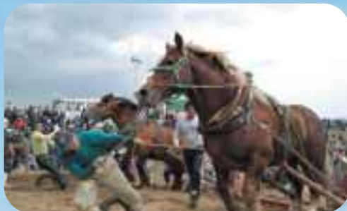
大観衆の馬力大会