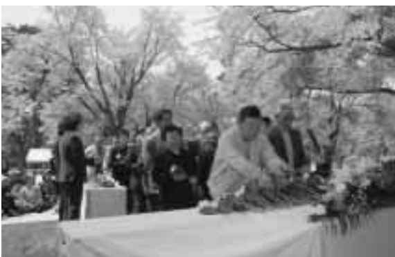
▲祭壇に献花する参列者