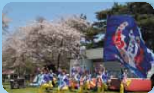
元気いっぱいの YOSAKOI !!