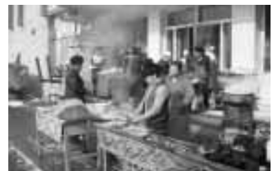
▲新疆での羊肉の焼肉 数年前から北京では超人気です

館へ行きました。以前は昭陽小学校だと聞きました。日本留学へ懂れていた私は、学校の様子を拝見しました。廃校といっても以前のもので、教室、音楽室、会議室、職員室など設備が揃って、幸せな学校生活を暮らしていたような気がします。体育館のステージ下の地下室の天井に、学校統合直前の児童たちの書き置きがいっぱい残って、離れたくない気持ちが漂っていました。少ない児童達ですけど、以前、「日本教育版画コンクールで協会賞(全国一位)に何度も輝く」というすばらしい成績を取った名門校です。学校の玄関の所とか、室内に版画作品があちこちに飾られて、木に彫られた浅かったり深かったりした白黒の作品に感動しました。手で書いても、相当難しいと想像しながら、彫りつづけた絵が実物どころか、未来も描いているような気がしました。