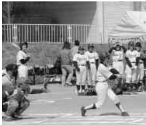
▲攻撃中の六中ソフト部

5月3日、4日に開催された第16回東北中学校男女選抜大会に青森県代表として六戸中学校女子ソフトボール部が出場しました。会場は八戸市新井田公園多目的広場。好天の中、予選リーグ3試合を戦いました。選手達は東北各地から集まった全国レベルの対戦相手に、日頃の練習の成果を発揮しようとして一生懸命プレーしましたが、残念ながら予選敗退しました。