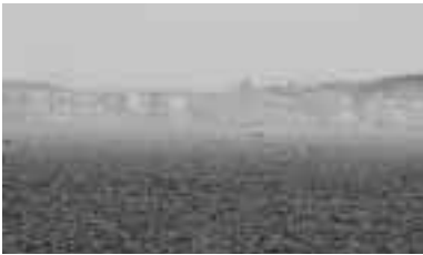
▲06年5月7日 山東小省蓬萊市蟹気楼10万人が観賞しました

私の人生で初めての桜は館野公園の桜でした。5月になり、やっと咲いて公園が賑やかになりました。館野公園の入り口の所に、「園内にゴミ箱はありませんので、ゴミは自分でお持ち帰りください」という看板があってびっくりしました。中国では「ゴミはゴミ箱に入れてください」という言い方が普通です。館野公園は、ゴミがなくてきれいだし、桜もきれいでした。