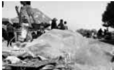
▲メーデーの中国寧夏銀川中山公園きれいですけど、ゴミがちよっと

たいビールのことをこう言います)、おいしそうラーメンなど、ずらっと並んでいました。人々が木の下に座って、食事したり、話が弾んだりして、祭りの雰囲気溢れていました。以前、私はテレビで桜を見たとき、高い木に咲くものだとは思わず、梅のように低い木に咲いていると思いました。高い木に咲いている花を初めてたくさん見て、自然に感動と尊敬の気持ちでいっぱいになりました。人々は花の下で、花に守られているような気がしました。