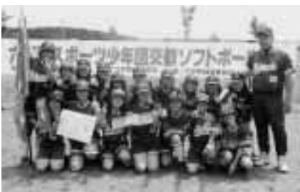
▲優勝した六戸スポーツ少年団