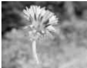
図1 セイヨウタンポポ