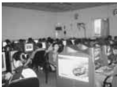
▲「インターネット パー」

です。生徒たちが運動場を舞台にして先生と親の前で自分の能力と個性を十分に発揮して、演技していることに感心しました。生徒たちが全員参加して、一人で勝負を決めるのではなく、全員で点数を取り合います。これが生徒全員の体力をアップすると同時に、みんなの集団意識も高めることかと思えます。それに、種目もいろいろで、単純の走りだけではなく、網を潜るとか、パンを食うとか、全部工夫された種目で、特に、応援合戦が面白く、踊りながら叫んで、相当賑やかでした。中国では、学年別で、各クラスからの