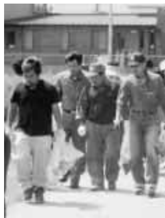
▲清掃に汗を流す参加者ら

この日、葉タバコ生産へのイメージアップとPRを図るため、県たばこ耕作組合による県内一斉の清掃奉仕活動が実施され、当町でも町内たばこ耕作青年・女性部約15名が、官庁街を中心に清掃活動を行いました。参加者はこの活動で少しでもイメージアップに繋がればと空き缶やたばこの吸い殻拾いに汗を流