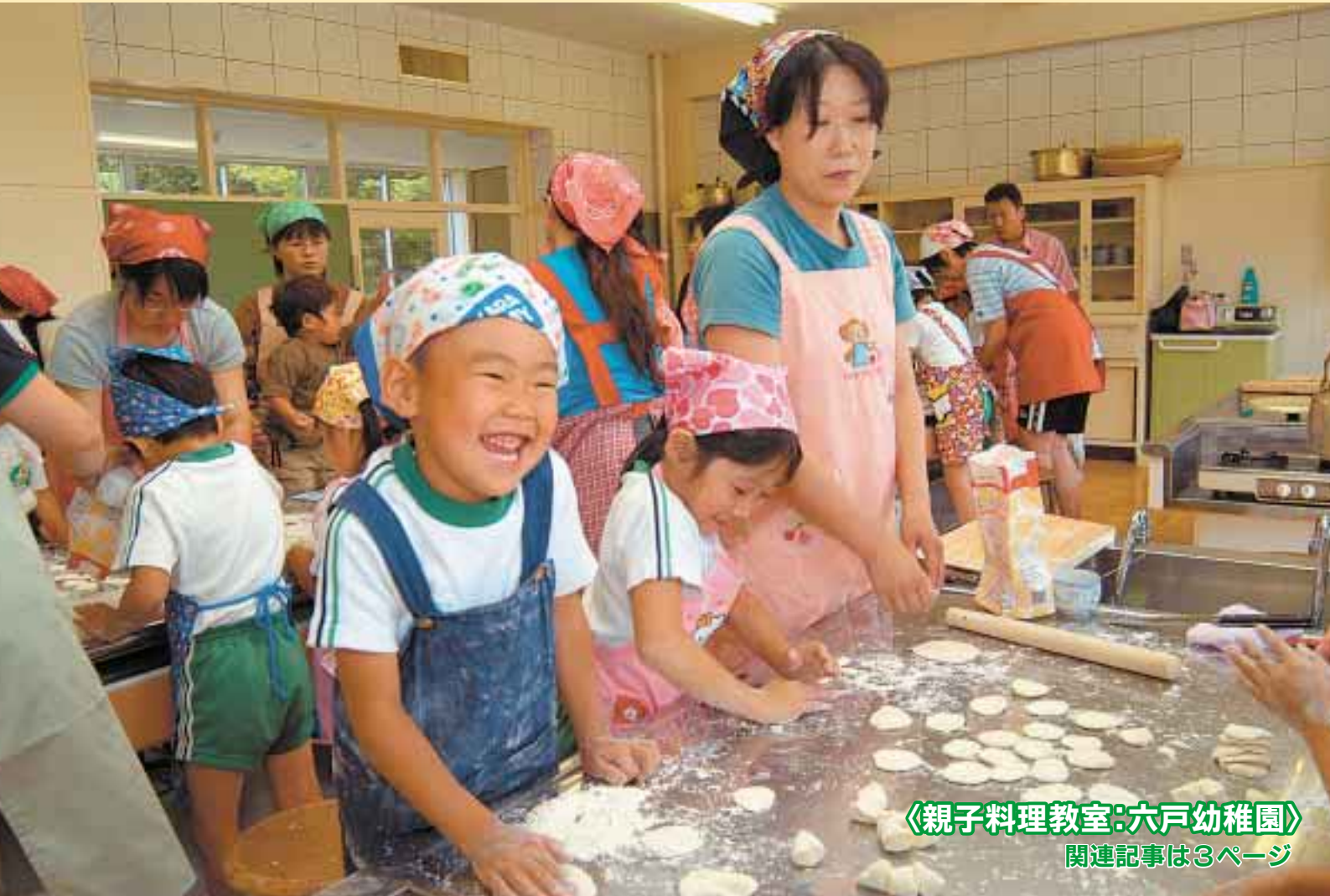
〈親子料理教室:六戸幼稚園〉 関連記事は3ページ

ホームページアドレス▶ http://www.town.rokunohe.aomori.jp 携帯電話用▶ http://www.town.rokunohe.aomori.jp/k.htm Lモード用▶ http://www.town.rokunohe.aomori.jp/lmode.htm