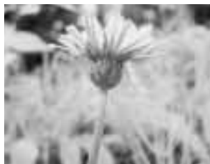
図2 日本のタンポポ(アキノ科)