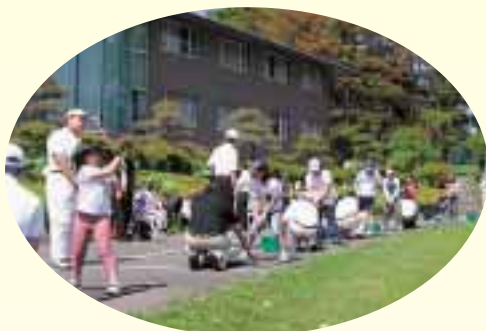
メイプルジュニアクラブ（6月～3月）