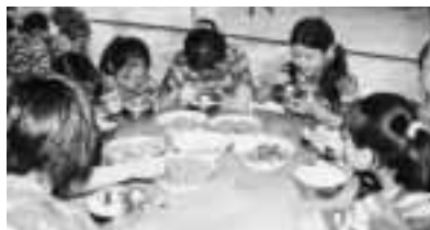
▲「生徒たちの軍営生活」

です。生徒たちが運動場を舞台にして先生と親の前で自分の能力と個性を十分に発揮して、演技していることに感心しました。生徒たちが全員参加して、一人で勝負を決めるのではなく、全員で点数を取り合います。これが生徒全員の体力をアップすると同時に、みんなの集団意識も高めることかと思えます。それに、種目もいろいろで、単純の走りだけではなく、網を潜るとか、パンを食うとか、全部工夫された種目で、特に、応援合戦が面白く、踊りながら叫んで、相当賑やかでした。中国では、学年別で、各クラスからの