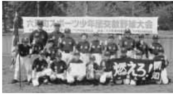
▲優勝した開知スポーツ少年団

5月20日、第27回 優勝 六戸町スポーツ少年団 開知スポーツ少年団 交歓野球大会が町 準優勝 営野球場において開 六戸スポーツ少年団 催されました。 第3位 大会には町内の4 折茂スポーツ少年団 チームが参加し熱戦 大曲スポーツ少年団 が繰り広げられ、開 なお、優勝した開知 知スポーツ少年団が スポーツ少年団と準優 優勝しました。 勝の六戸スポーツ少年 結果は次のとおり 団は、それぞれ六戸町 です。 代表として十三地区 の大会に出場します。