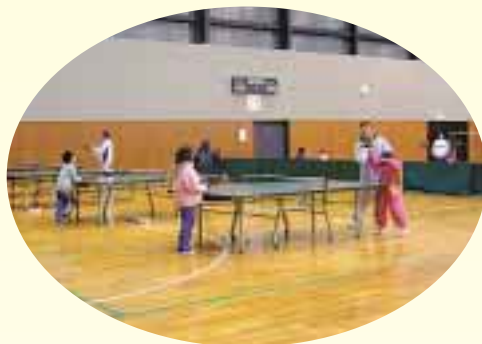
軽スポーツ教室（1月～3月）