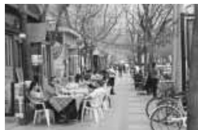
▲「北京三里屯 名酒飲みパー」

日本人の文化は先進の物をそのまま受け取るように思われます。例えば、外来語の言葉もそのままを模倣しているように感じます。先進国の文化の吸収が早い。中国の場合、自分の国情に合うかどうかまず考えます。独立性を強調しているような気がします。