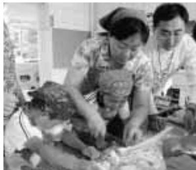
▲ギョーザの皮も手作りです

てくれました。年齢が小さいけど、何を教えてもすぐ覚えてくれて、別れる時、私の話を模倣して、標準の発音で「再見」（さようなら）でも言ってくれました。ギョーザは中国のイメージですよ。子供たちにこのイメージだけ伝えられたら、満足だと思います。中国のことわざで「心地よさは寝るほどはなし、おいしさはギョーザほどはなし」とあります。でも、この話は何十年前のことで、今現在、北京では北京ダックでもだんだん人気がそれほどではなくなってきました。いろいろ、中国各地の料理が北京で競り合われています。もし、お金があったら、世界各地の料理が味わえます。この後の数日後、子供たちから、料理教室の絵と感想を頂いて感動しました。初めて、自分の肖像画を見ました。後ろに著作者のサインが載っていますよ。超かわいいですよ。そういうふうになりたいとも思いました。北京でも、人々は、『店で買った高い物より手作りの物をいただくことの方がずっとうれしい。』といいます。この子供たちからもらったものは大事にしていきたいと思います。