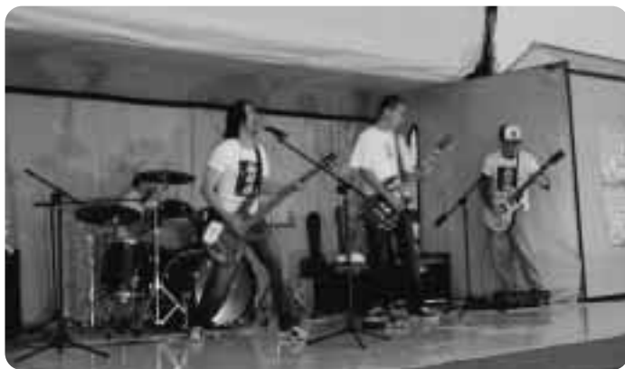
▲祭りを盛り上げたバンド演奏

のない子供たちに臨機応変に対応するなど見事なママ・パパぶりをみせ、子育ての大変さを実感した様子でした。