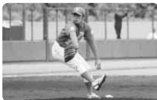
▲投手の球もプロ級です!! (社会人野球)

都市対抗野球は、全国大会への2枠を懸け東北の12チームが熱戦を展開。企業チームやクラブチームというところもあり、プロに劣らないレベルの高いプレーに、観客からは大きな声援が飛んでいました。また、各チーム地元から駆けつけた応援団は、旗やメガホン、応援ボードなどを掲げ、息の合った応援で選手を盛り上げていました。