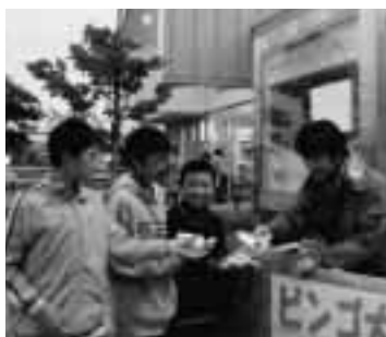
サマーフェスティバルで球根プレゼント