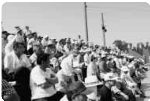
▲たくさんの高校野球ファンが来場しました

このほど、六戸町総合運動公園野球場（メイプルスタジアム）にて、7月1日から7日まで第77回都市対抗野球第2次予選東北大会、7月13日から19日まで第88回全国高校野球選手権青森大会が開催され、県内はもとより、県外からもたくさんの方々が応援や野球ファンが観戦に訪れました。