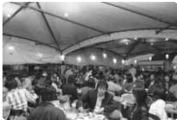
▲小雨のなかでも生ビールは大盛況でした!!

会場では、六戸町緑化推進委員会からサフランの球根無料プレゼントやバンド演奏、ビンゴ大会が行われ、祭り気分を盛り上げました。ビンゴ大会では、花火にすいか、生のうなぎにじじみ貝と、夏に欠かせない景品が登場し、観客を沸かせました。 サマーフェスティバルはあいにくの小雨でしたがこれらが夏本番。体調・安全には気をつけて楽しい夏を過ごしましょう。