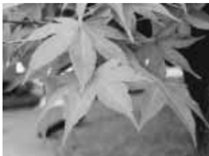
(官庁街通りのヤマモミジ)