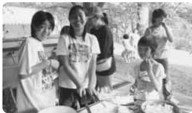
▲みんなで楽しく夕食の準備中!

館野公園で7月27日、28日、「戸の兄弟のまち交流キャンプ」が開催され、当町と岩手県九戸村の子どもたち約50名が交流を深めました。