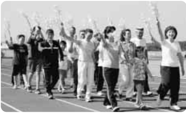
▲“華”のある入場行進を披露

天候は快晴、雲の陰一つないフィールド、絶好の運動会日和。8月6日、総合運動公園陸上競技場で町民運動会が開催され、たくさんの方々が爽やかな汗を流しました。