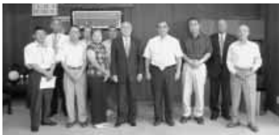
▲吉田町長を囲んで記念写真