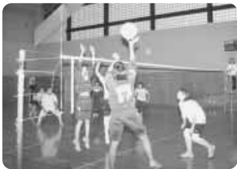
▲ソフトバレーを楽しむ参加者ら

7月30日、第40回子ども会スポーツ大会が町総合体育館において開催され、各町内会子ども会がスポーツを通して交流を深めました。当日は、朝からあいにくの雨模様。ソフトバレーホール、グラウンドゴルフのほかに、当初予定されていたキックベースはドッジボールへ変更されましたが、参加者らはフット溢れるプレーで会場を盛り上げていました。