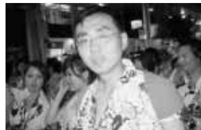
初体験“ねぶた”“跳人”

てくれました。アフリカ人で、また英語圏の方でした。顔だけでは国を判別しにくいですね。参加者は大体50人ぐらいで、指導員について街を歩きました。外国人の集団なので、結構注目を集めました。私は外国人に見えないだろうなと思いました。次は、「らっせら」という掛け声です。ひとつのどっかいねぶたの前で踊りました。初めは、恥ずかしくてなかなか声が出せなかったけど、せっかくだと思って頑張り、「らっせら」と大声を出しました。本当に賑やかでした。みんな興奮して、叫んだり、踊ったり、たまに元気な人が前に出て、「らっせら」をしました。行進の途中、突然列の中で、一人の踊り手を囲んで、一行の人たちが踊りながら一斉にぶつかっていきました。私は、その姿を見て、すぐ逃げました。私は、メガネをしていたら落ちるんじゃないかと思って注意して見たら、メガネをしている人はいませんでした。でも、雰囲気がよくて、面白く感じました。2時間ぐらいたって、結構疲れましたが気持ちがよかったです。みんな一緒に叫んだり、踊ったり、おもしろ