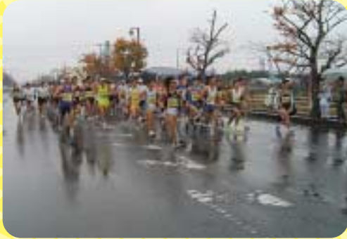
▲雨のなかお疲れさまでした