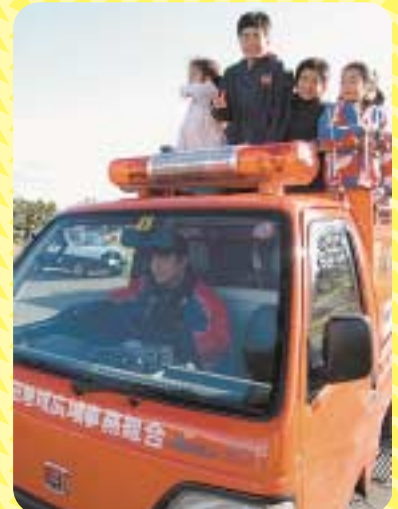
▲サイレンを鳴らしミニ消防車体験

「我が家のたから」に掲載する写真大募集!! 広報「ろくのへ」では我が家のたからコーナーに掲載するかわいい子供の写真を募集しています。掲載を希望される方は、下記までご連絡ください。町内在住の6歳以下の子供であればごなたでもよろこびます。 多数のご応募お待ちしております。