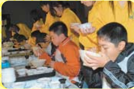
▲がんばれ!全日本とろろ早食い選手権大会