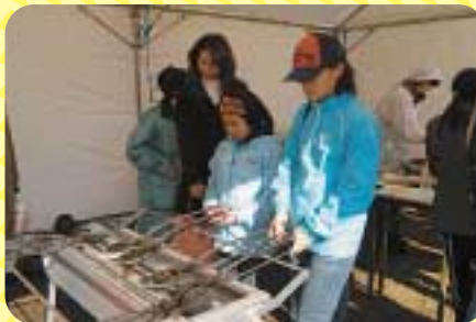
▲大好評のメイプル煎餅焼き