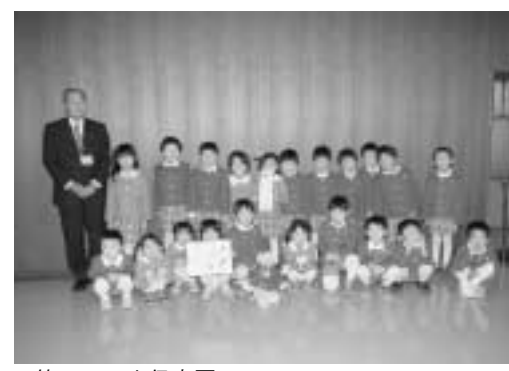
▲第一日の出保育園

「皆さん毎日のお仕事ご苦労さまです」と大きな声で役場を訪問してくれたのは、小さな応援隊。 勤労感謝の日にあわせて町内の第一日の出保育園の園児21名が第一