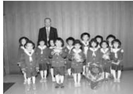
▲第二日の出保育園

「皆さん毎日のお仕事ご苦労さまです」と大きな声で役場を訪問してくれたのは、小さな応援隊。 勤労感謝の日にあわせて町内の第一日の出保育園の園児21名が第一