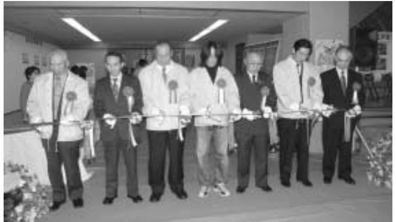
▲テープカットでスタート!!

毎年恒例となっている、メイプルタウンフェスタ2006が11月11日、12日の両日、総豆体育館と文化ホールを主会場として盛大に開催されました。 初日は雨が降る、あいにくの天気にもかかわらず、メイプルマラソン大会にはたくさんの方々が参加。参加者は記録を目指し、官庁街通りを走り抜けました。