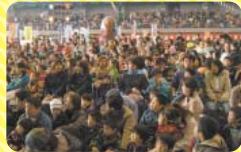
▲大観衆が詰めかけたボウケンジャーショー