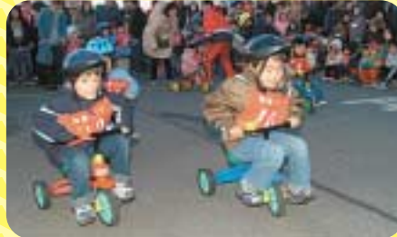
▲チビッツ「三輪車レース」