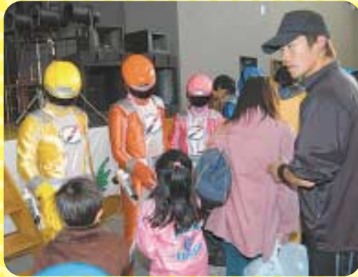
▲ボウケンジャーとの握手会に子ども達は大喜び!