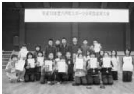
▲熱戦を繰り広げた選手ら

2月26日、六戸町総合体育館において、平成18年度六戸町スポーツ少年団卓球大会が行われました。この日は、24名の児童が参加。