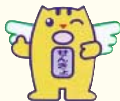
明るい選挙イメージキャラクター 選挙のめいすいくん