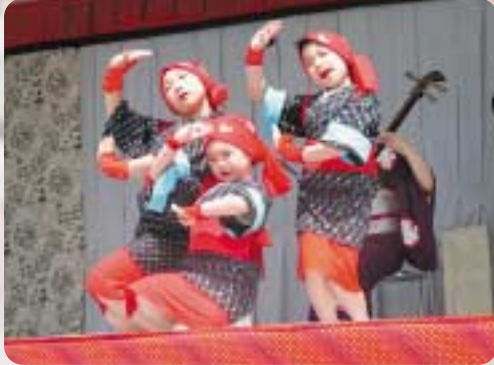
▲かわいらしい踊り手に拍手喝采

4月27日から5月6日まで「ろくのへ春まつり」が館野公園をメイン会場として開催されました。 今年の桜は連休中に満開を迎え、六戸町内外の観光客がたくさん訪れました。