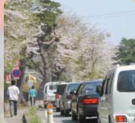
▲ゴールデンウィーク中の1ショットです たくさんの方が来園されました

「我が家のたから」に掲載する写真大募集!! 広報「ろくのへ」では我が家のたからコーナーに掲載するかわいい子供の写真を募集しています。掲載を希望される方は、下記までご連絡ください。町内在住の6歳以下の子供であればごなたでもよろしいです。多数のご応募お待ちしております。