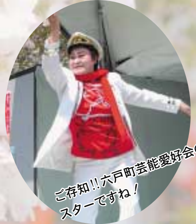
ご存知!!六戸町芸能愛好会のスターですね!