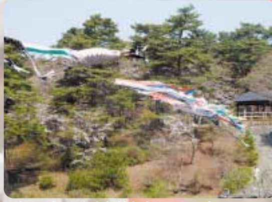
▲鯉のぼりたちも気持ち良さそうです