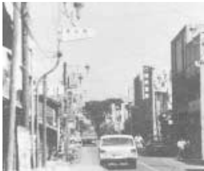
▲六戸町中央商店街 (昭和46年(1971年) 町勢要覧より掲載)

そして、パチンコホールの奥にある「六戸文化」は現在の「衣料センターかわむら」の場所にあり、映画を上映したり、演芸会やコンクールなどが催されていた。パチンコホール同様、流行の場所でした。その当時、映画の上映案内などは自動車にスピーカーを乗せた宣伝車で町内を走っていました。映画の料金は50円くらいで、2、3本立てで上映されていました。