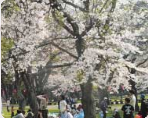
▲満開の桜の下でひととき...