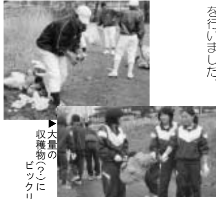
▶大量の 収穫物の中に ビックリ

多くの春まつりに訪れる観光客に清々しく楽しんでもらおうと、4月25日、六戸高校の生徒が館野公園内外のゴミを拾うボランティア活動を行いました。