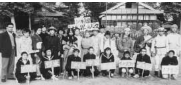
▲六戸中学校2年A組の文化祭記念写真(昭和38年)