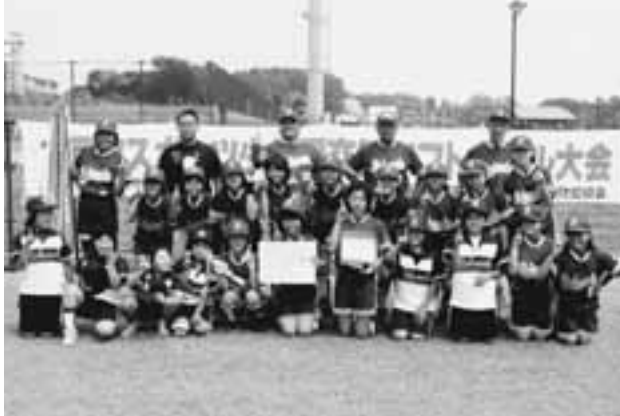
▲優勝した六戸スポーツ少年団のメンバー達