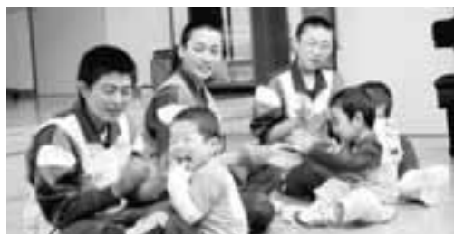
▲園児の笑顔が印象的

ふれあい体験学習は、中学生が実際に乳幼児とふれあい、一緒に遊び、そして基本的な生活習慣(おむつ交換、食事など)の世話を体験するものです。体験学習は、第一日の出保育園(長嶺きみ園長)にて行い、六戸中学校51名、七百中学校37名の3年生が参加しました。生徒1人に対して乳幼児1人を担当します。生徒たちは、始めはとまどっていたものの、徐々に子供たちに慣れてきて、食事の時間はすっかり打ち解けた様子でした。