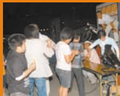
ビンゴゲーム大会の景品は何でしょう？