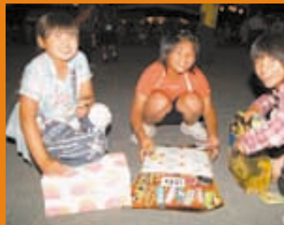
ガマンできずに中を開けちゃった

「我が家のたから」に掲載する写真大募集！！ 広報「ろくのへ」では我が家のたからコーナーに掲載するかわいい子供の写真を募集しています。掲載を希望される方は、下記までご連絡ください。町内在住の6歳以下の子供であればごなたでもよろしいです。多数のご応募お待ちしております。