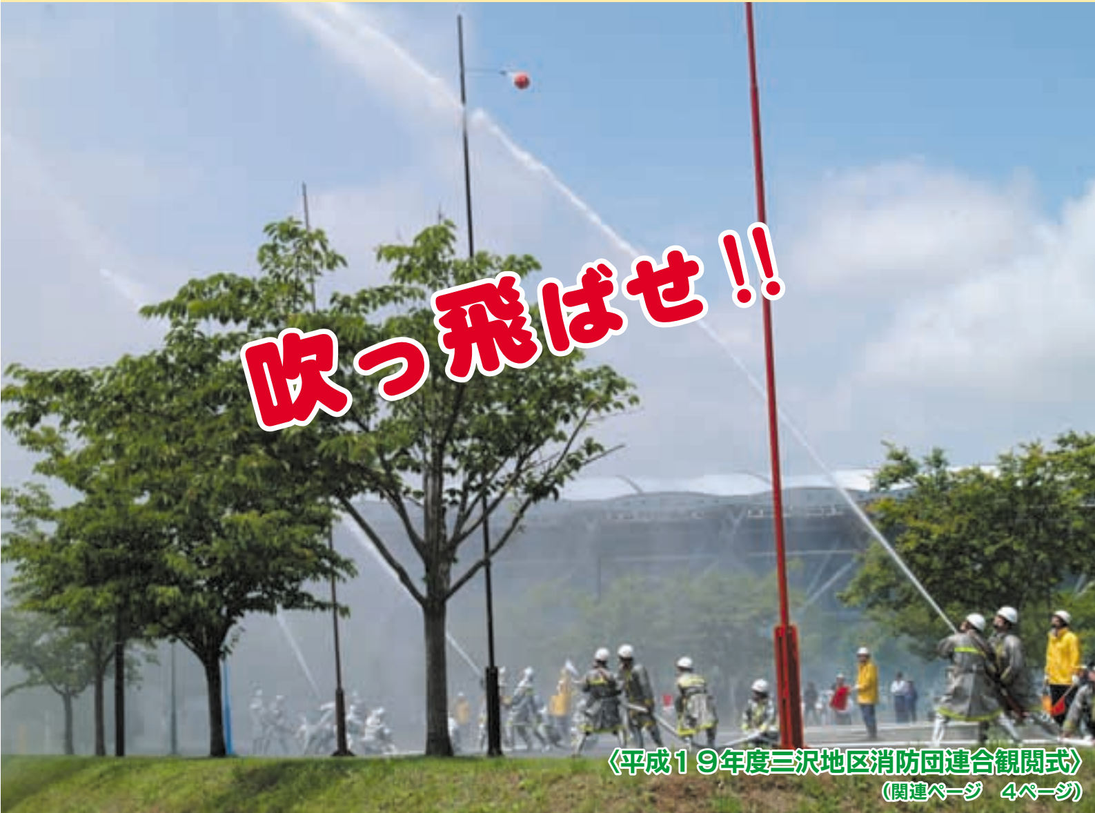
〈平成19年度三沢地区消防団連合観閲式〉 (関連ページ 4ページ)