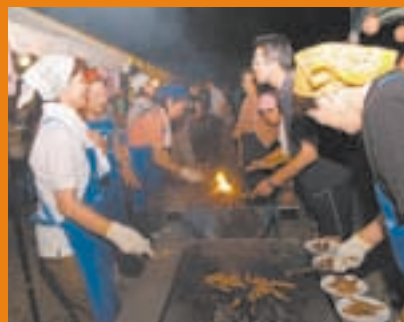
おいしい焼肉はいかが？