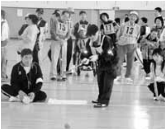
▲団体競技の最後「ゲートボール」のワンシーン

この大会には、六戸町社会福祉協議会のスタッフの他にも、六戸高校からボランティアとしてスタッフ参加した生徒たちもいました。参加選手やその家族、多くのスタッフらで優勝の喜びを分かち合いました。