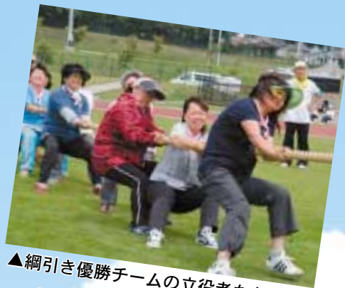
▲綱引き優勝チームの立役者たち