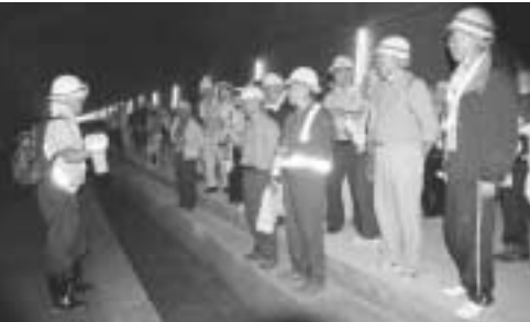
▲休憩がてらにトンネルの説明

参加者らは、トンネル内部を見ながら歩き、所々では、トンネルの発注者である鉄道・運輸機構東北新幹線建設局の担当者（説明もあり、トンネルに対して知識を深めながらのウォーキングとなりました。） 約1時間をかけてのウォーキングで、参加者らの額には汗が流れ、表情は爽やかでした。