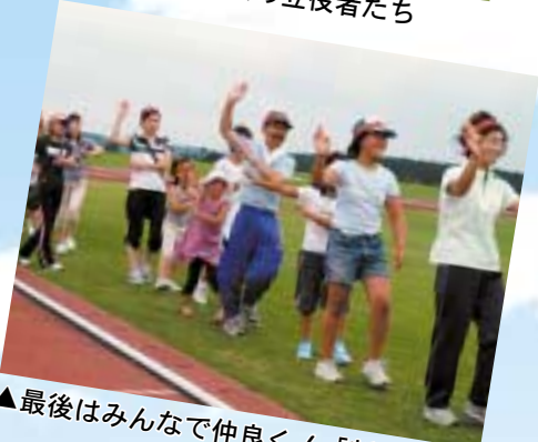
▲最後はみんなで仲良く！「新六戸音頭」