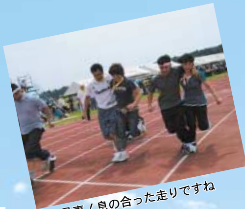
▲お見事！息の合った走りですね