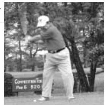
◀豪快なスイングの小村光市町民ゴルフ大会実行委員会会長（右）と吉田町長（左）