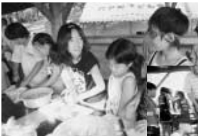
▲夕食を作っている様子の六戸と九戸の子供たち