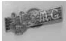
▶春風楽団のバッジ。SMGは、Spring March Groupの意味だそうです。