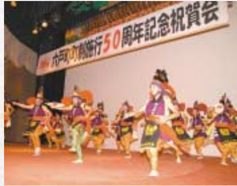
▲鶴喰鶏舞保存会(左)と上吉田駒舞保存会(右)による郷土芸能の共演