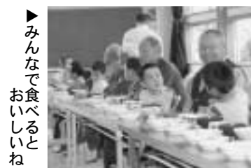
▶ みんなでお食いしとね