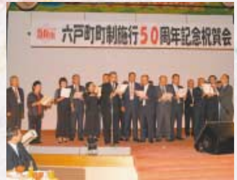
▲「六戸町町制施行記念の歌」をみんなで合唱