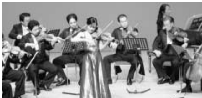
▲N響メンバーと千住真理子さん(中央)

町制施行50周年を記念して、ヴァイオリニストの千住真理子さんとNHK交響楽団のメンバーらで構成された合奏団のコンサートが、10月4日に文化ホールにて行われました。 開演時間が迫り、いよいよ演目がはじまりました。 千住真理子さんの所有している名器「ストフディバリウス」音色を聞こうと大勢の観客が集まり、そして会場内は優美で綺麗な旋律で埋め尽くされ、観客らはうっとりとした表情で聞き入っていました。