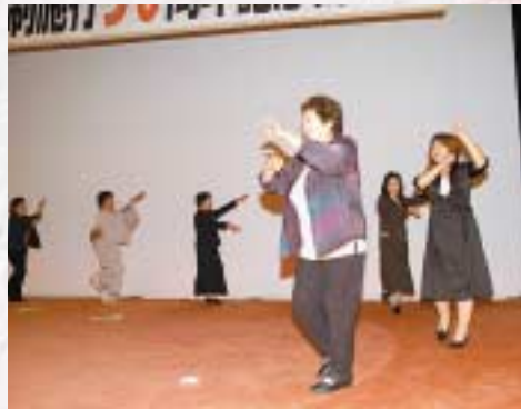
▲昭和53年まで踊られていた「六戸音頭」を再現