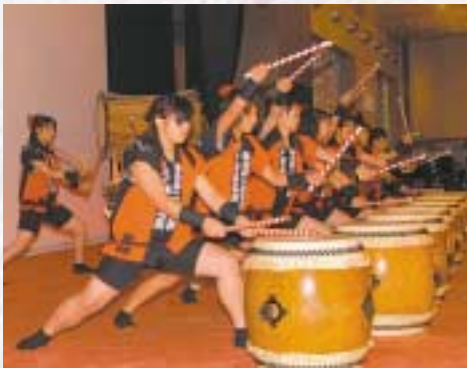
▲海上自衛隊八戸航空基地女性隊員による「華炎太鼓」