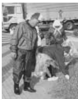
▲ゴミを拾う会員ら

10月17日(水)、社団法人おいらせ広域シルバー人材センターの会員らが、町の環境美化を目的として、官庁街通りや周辺のゴミ拾いなどの清掃奉仕活動を行いました。 会員らは道路沿いの歩道脇に投げ捨てられた空き缶やタバコの吸殻などのゴミを集め、町の環境美化に努めました。 善意のご協力に感謝いたします。