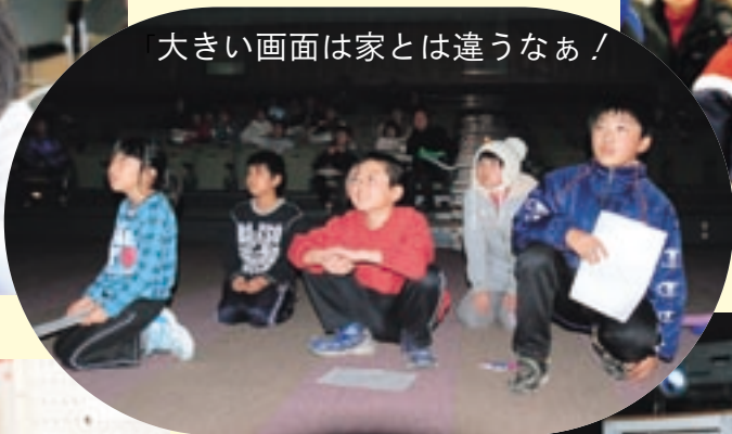
大きい画面は家とは違うなあ!