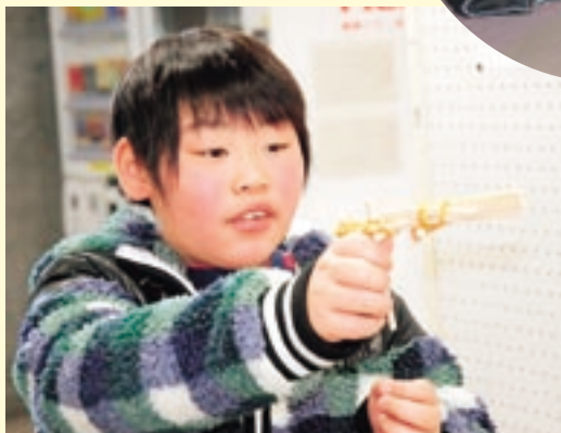
「ぼくの作ったでっぼう、的に当たるかな!」