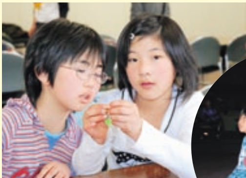
カラフルなビーズ作りに熱中!?

また、大ホールでは巨大スクリーンでゲーム大会が行われ、たくさんの小学生たちが迫力ある画面を前に熱狂し、会場内は熱気に包まれていました。