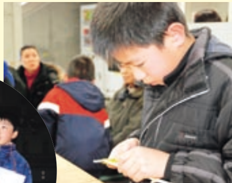
ゴムでっぼう作りに真剣!