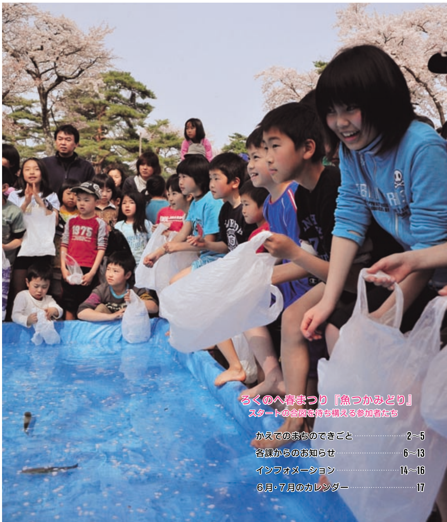
ろくのへ春まつり『魚つかみどり』 スタートの合図を待ち構える参加者たち