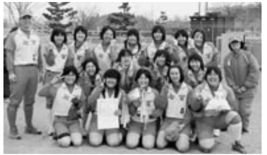
見事優勝した七百中ナイン

5月3日、三沢市南山屋外運動場にて、第20回三沢地区中学校ソフトボール大会が開催され七百中学校ソフトボール部が見事3大会ぶりの優勝を果たしました。