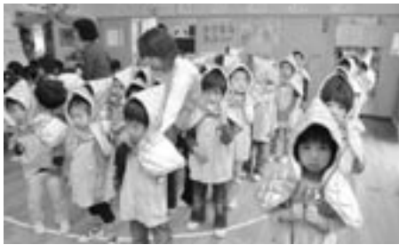
防災ずきんをかぶる園児たち