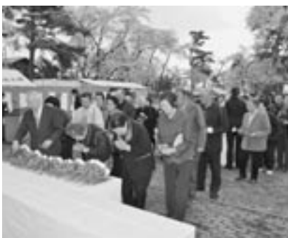
招魂碑前で、献花し手を合わせる参列者