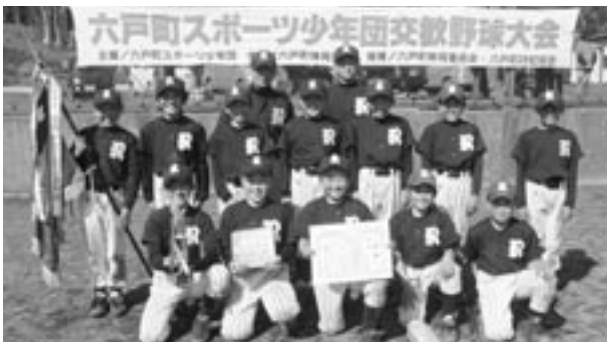
見事優勝した六戸SSナイン

5月15日、第33回六戸町スポーツ少年団交歓軟式野球大会が町営野球場において開催されました。