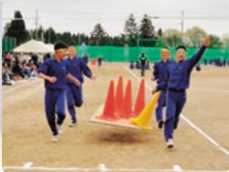
七百中 学年対抗「力をあわせて」 3年生余裕の勝利、下剋上ならず!

ようやく咲いた桜もあっという間に葉桜になると、町には少しずつ夏の日差しが注ぎこんできます。週末のグラウンドでは、さんさんと輝く太陽のもと、一生懸命競い合う子どもたちの歓声と、応援に集まった家族の声援がこだまします。