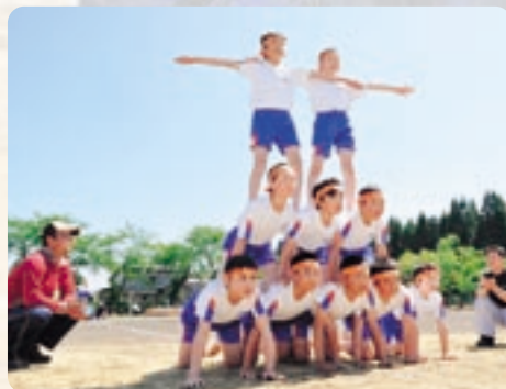
開知小 復活! 「風林火山 2010」 力を合わせ、ピラミッド完成!