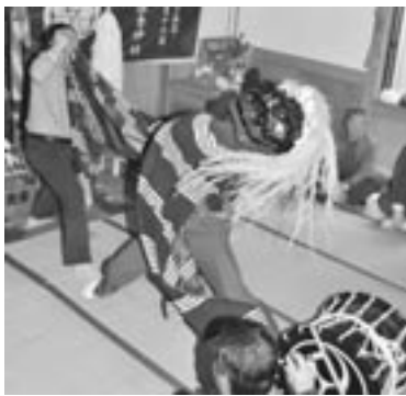
奉納の今熊神楽「権現舞」

例祭では、まず、宮司が神事を執り行い、村の代表者により玉串が奉てんされた後、折茂に代々伝わる今熊神楽が奉納されました。 秋になると、保食神が山へ帰る日に、その年の稔りを感謝する秋の例祭が行われるということです。