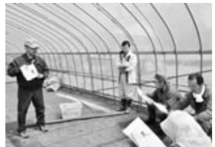
育成のポイントを説明する講師と熱心に聞き入る参加者

4月27日、県の農業普及振興室職員とおいらせ農協六戸支店指導課職員を講師に、水稻の健苗育成現地指導会が行われました。開催場所である町内各苗代ハウスでは、参加者が講師の説明に熱心に耳を傾けていました。