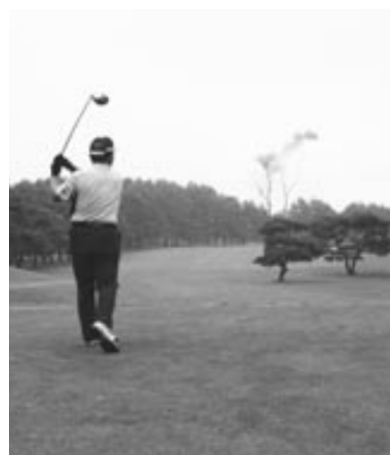
大会始球式の様子(OUT1番ホール)