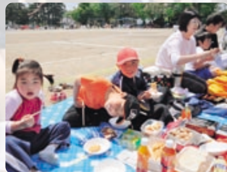
みんなで食べる運動会のお昼は、また格別!