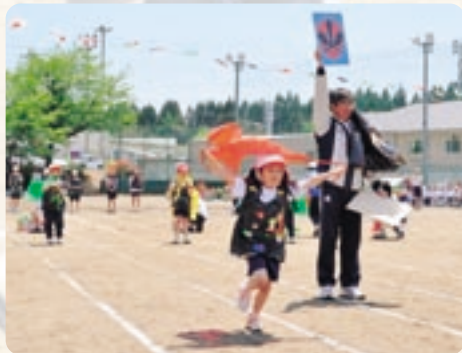
大曲小 走れ! マントマン 隊長(校長先生)の合図で出動!