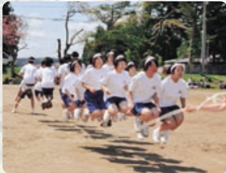
六戸中 Jnmping to win 勝利を目指して、心を一につにJumping!!