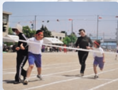
六戸小 ザ・借り人競走 借りる人、借りられる人、協力してゴール!