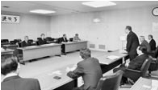
多良木町議員と意見交換の様子

は「多良木町で行っている子ども医療費助成事業は小学6年生まで。若者を支援する方策として、当町でも中学3年生までにすることを検討し