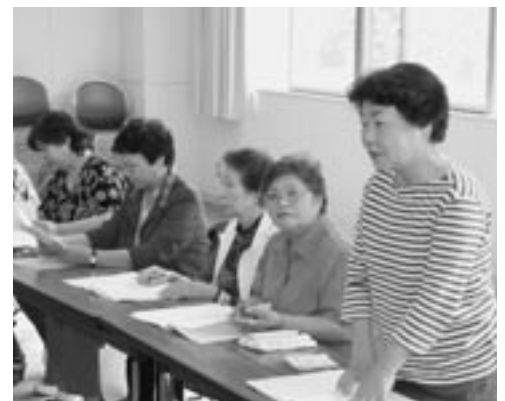
学習テーマを発表する受講者

6月17日、町民講座「夢生(ゆめおい)学習塾」の開校式が町文化ホールで行われました。これは、学びたい思いを持つ仲間とともに、自主的にテーマを決めて学習していく活動です。