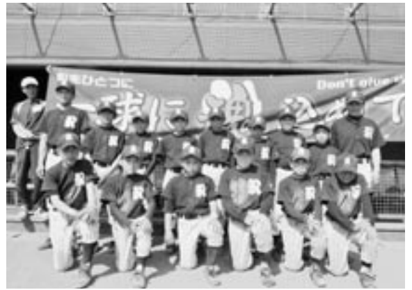
試合後、次戦への決意を胸に