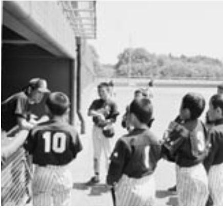
決勝直前のミーティングの様子

合で1点差で敗れている上久保タイガース（三沢市）と対戦。序盤から相手投手を崩せそうに崩せない歯がゆい攻撃が続きます。逆に、相手チームにチャンスをもたされ、0対4