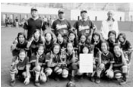
優勝に笑顔がこぼれる六戸スポ少ライン

6月22日から24日にかけて、第20回六戸町スポーツ少年団ソフトボール大会が町総合運動公園多目的広場において開催されました。町内3チーム総当たりの末、六戸スポーツ少年団(以下「六戸スポ少」)が優勝。六戸町の代表として、続く県大会に出場しました。県大会は、7月10日から11日かけて、つがる克雪ドーム(五所川原市)を会場に行われました。