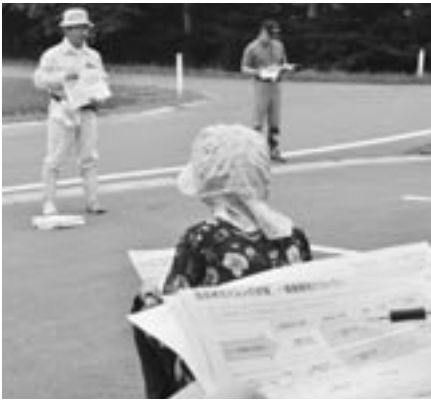
現地指導会の様子（鶴喰会場）

春先、低温の影響で遅れていた生育状況も、その後の天候回復でほぼ平年並みに達する見通しです。指導にあたった農協指導課職員からは、「これからは、穂ばらみ期に低温になった場合に水管理に注意すること。それと、害虫の発生が平年よりも多めなので、お盆期間前後の防除が重要になるだろう。」と、参加者に育成のアドバイスをしていました。