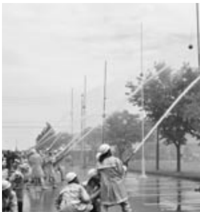
玉落とし競技の様子