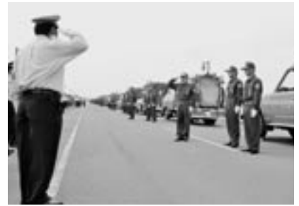
車両部隊観閲の様子

6月27日、平成22年度三沢地区消防団連合観閲式が、三沢市南山屋外運動場で行われました。