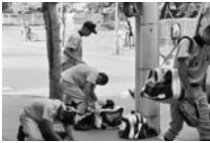
ベンチ裏、その場にうづくまる六高ナイン