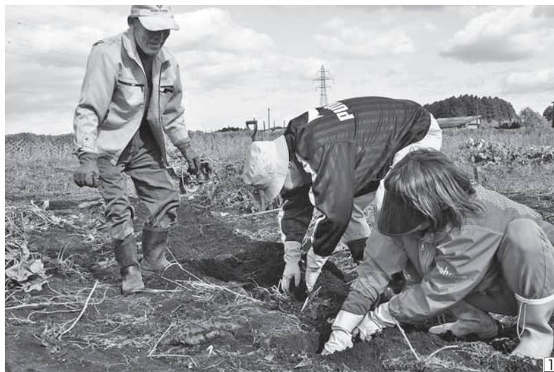
① さつまいもの収穫を楽しむキャンパスのオーナーのみなさん