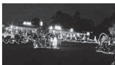
この家の敷地内に10万個ものライトを設置してあります。

始まります。家にプラ製（本物を飾っている家は少ない）のクリスマスツリーを設置して、みんなが飾りつけます。しかし、夏なのにスプレーで白く吹いて雪を見せかけるのもなぜか人気です（笑）！この時期から、デパートや商店街も飾られることが多いです。クリスマスソングの歌も、嫌になるほど流されます。それから、クリスマスツリーだけじゃなく、時間とお金をかけて家の周りもライトアップをして、家族もいます。アデレードの近くに約800世帯で8割が参加してライトアップの有名な町があります。州内外、そして外国からも1ヶ月間約25万人の観光客が訪れていると推定されています。