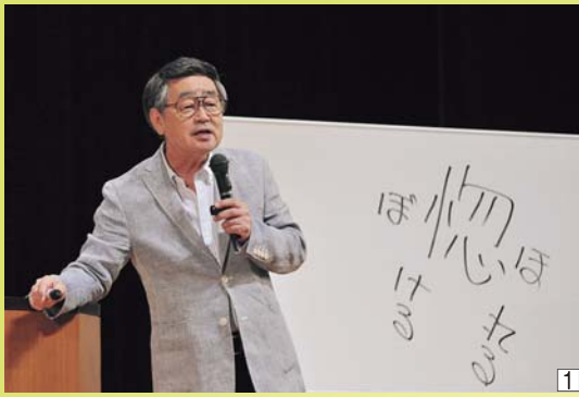
① 「言葉あそび」を交えた軽妙なトークで会場を沸かせた伊奈かつべい氏。『惚(ぼ)ける』も『惚(ぼ)れる』も漢字は一緒!

10月2日六戸町社会福祉協議会主催の社協まつりが文化ホールで開催され、約500人が来場しました。