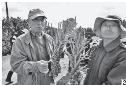
② 参加者らにびっしり実のついた「芽キャベツ」が配られた