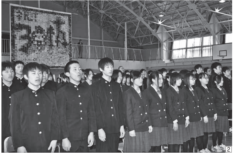
② 同校の校歌を歌う在校生ら