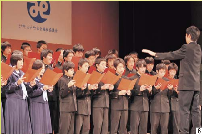
⑥ 復興支援曲として注目されている「あすという日が」を六戸中学校3学年が合唱。イベントのフィナーレを締めくくった