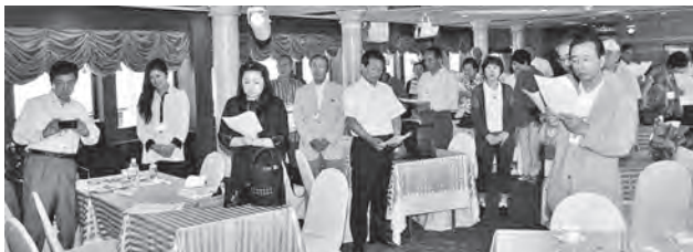
参加者で「ふるさと」を合唱