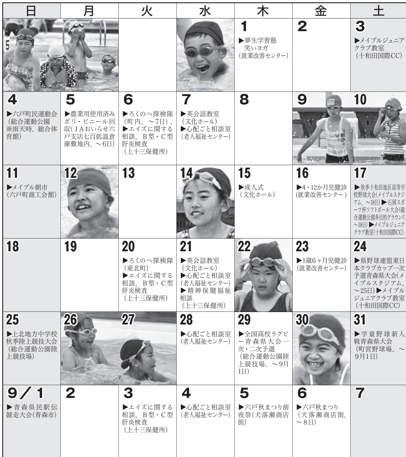
[今月の写真：六戸小学校水泳教室]