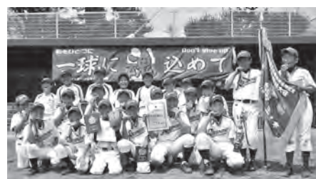
優勝した六戸スポーツ少年団