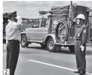
①② きびきびとした動作で統制のとれた行進・点検の所作を披露 [分列行進・車輛点検]