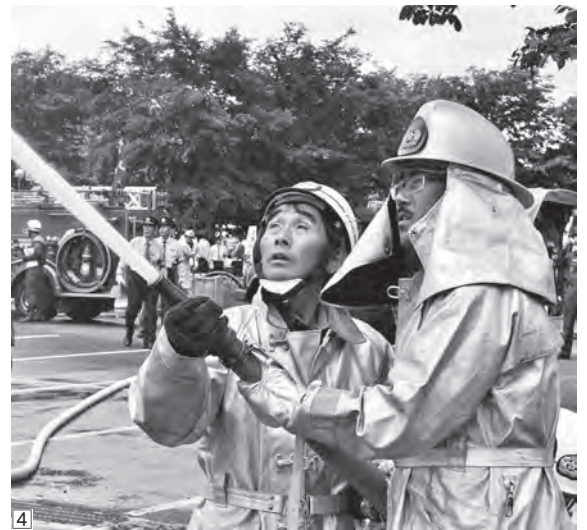
④ 玉落とし競技に臨む六戸町消防団の団員たち