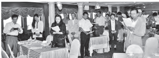
参加者で「ふるさと」を合唱