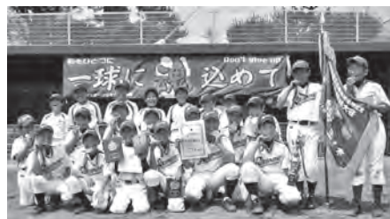
優勝した六戸スポーツ少年団