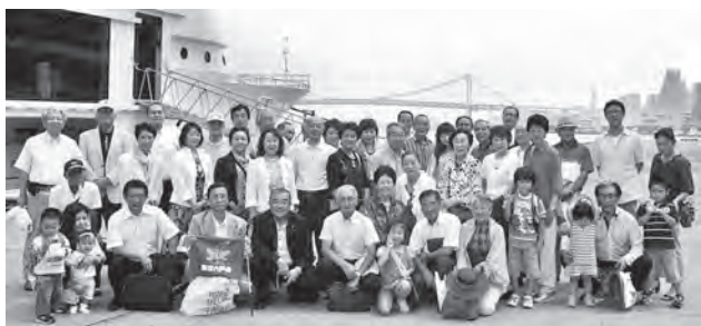
クルーズ船前でレインボーブリッジを背に参加者全員の記念撮影