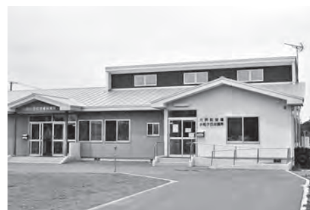
小松ヶ丘出張所の外観