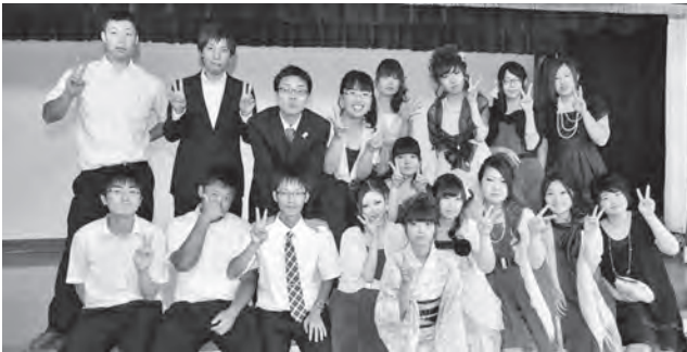
再会を喜ぶ大曲小・七百中卒の新成人たち

8月15日、平成25年度成人式が文化ホールで行われ、スーツやサマードレス、浴衣に身を包んだ87人（男性37人、女性50人）の新成人が式典に臨み、大人への決意を新たにしました。