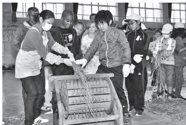
▲脱穀作業をする両校の児童たち