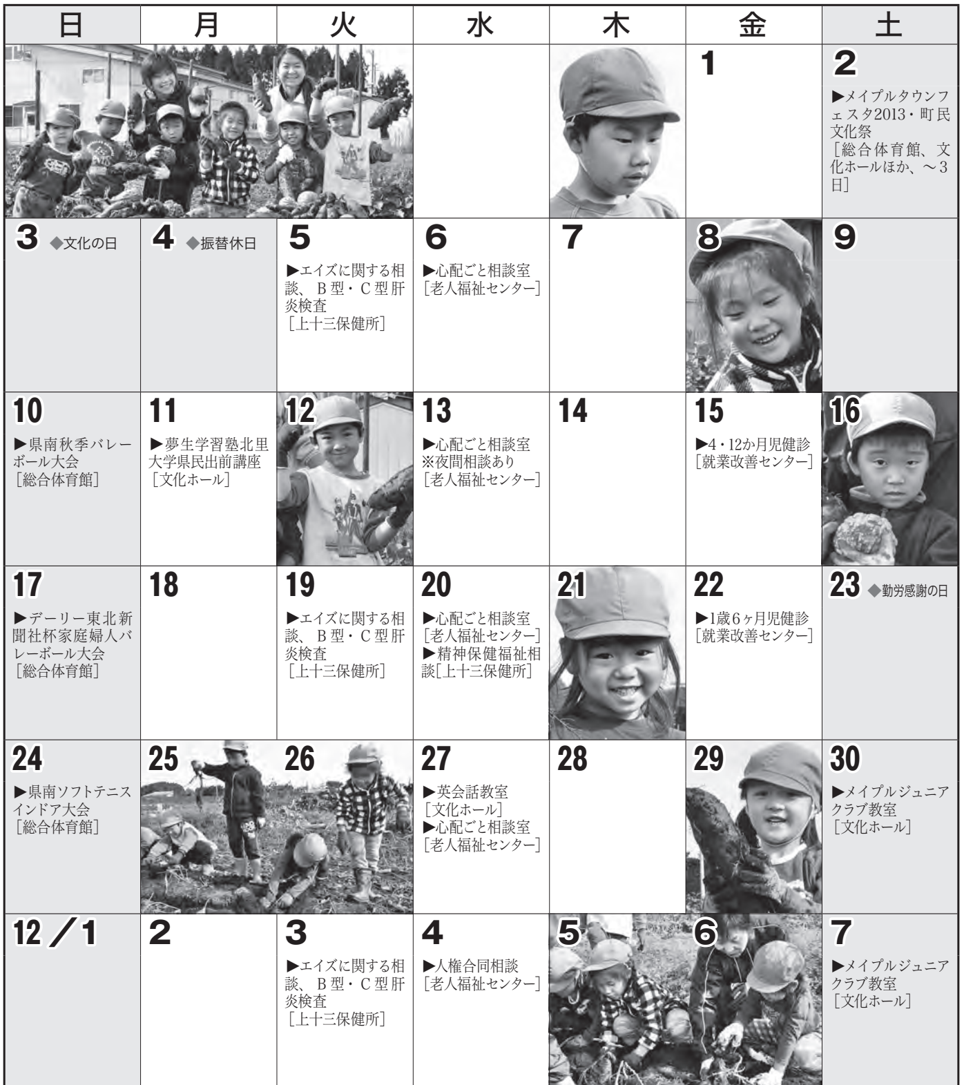
[今月の写真：楽農キャンパス収穫体験(六戸幼稚園)]