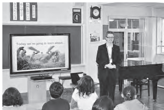
▲トムさんによるプレゼン「脱穀の歴史」

11月には、再度カミングス小学校の児童らを招き、今回収穫したもち米を使って、もちつき集会を行う予定です。