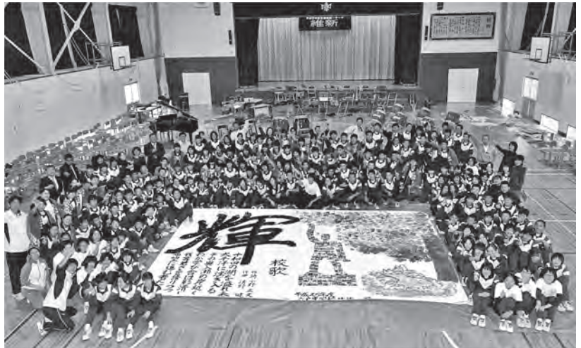
▲全校生徒で作り上げた「Our maple tree」