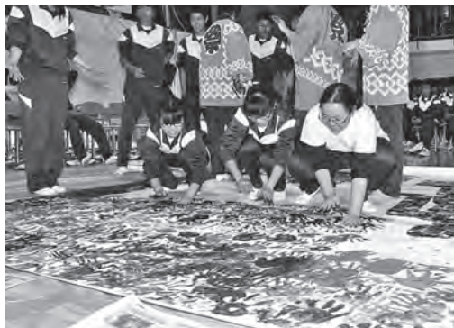
▲カエデの葉を生徒の手形で表現する