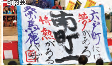
南部のお囃子 一堂に

会場では、懐かしの車が一堂に会する「クラシックカーミーティング」が開かれ、たくさんの車好きが足を止めて見入っていた