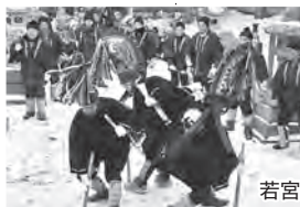
若宮八幡宮奉納摺り

2月15日(土)・16日(日)・17日(月) 午前9時～午後4時 おいらせ町分庁舎周辺