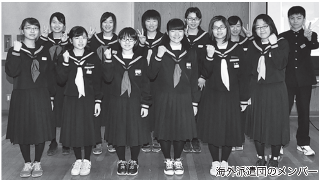
海外派遣団のメンバー