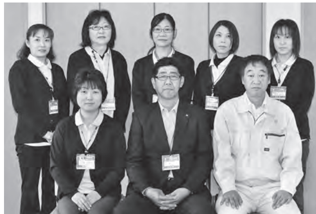
☎六戸町地域包括支援センター ☎27-6688

早く町民の皆さんに顔を覚えてもらいたいと思っております。どうぞお気軽にお立ち寄りください！