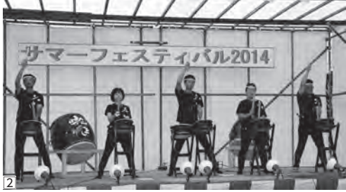
②会場を沸かせた「囃子やー」によるお囃子太鼓