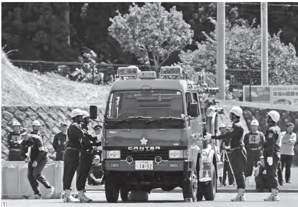
①2日ごとの練習の成果を発揮する、六戸町消防団第6分団の団員たち