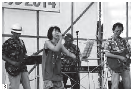
③完成度の高い演奏を披露した「アマチュアバンドライブ」