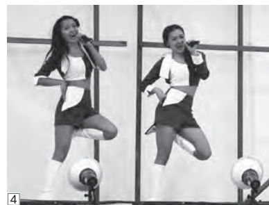
④エコがテーマのガールズユニット「アースガールズ」によるライブ

六戸の夏の夜が最も盛り上がる『サマーフェスティバル2014』が7月25・26日の2日間、総合体育館駐車場特設会場で開催され、期間中のべ2,400人が恒例の真夏のイベントを楽しみました。