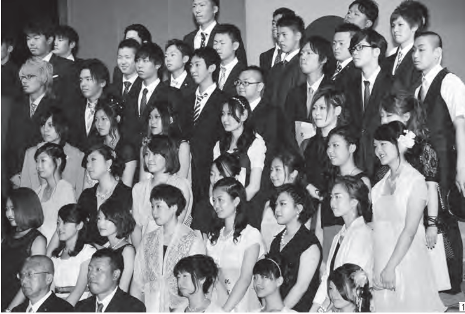
①記念撮影に臨む新成人たち