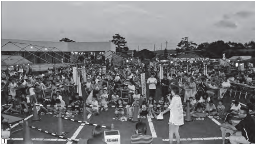
①ビンゴ大会で盛り上がる会場内