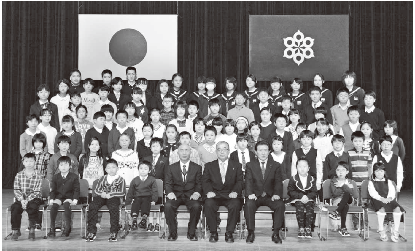
▲教育奨励賞受賞者