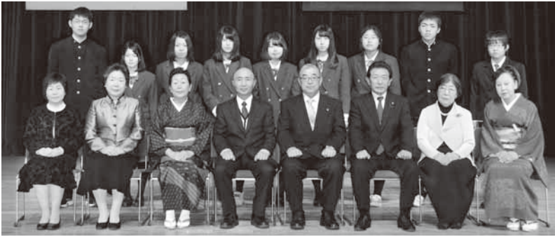
▲芸術・文化賞受賞者 ▼体育・スポーツ賞受賞者