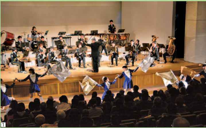
1 青森県警音楽隊による「安心・安全まちづくりコンサート」では、ドラマやアニメの主題歌など、なじみのある曲の演奏やカラーガード隊の演技のほか、特殊詐欺被害防止を呼び掛ける寸劇も行われた

今回は青森県警音楽隊によるコンサートが行われ、会場には子どもからお年寄りまでのたくさんの町民らが来場。水墨画や押し花、生け花、軽スポーツ、太極拳などの各コーナーでさまざまな体験に挑戦したり、各種講座に参加したりと、思い思いに「学び」を満喫していました。