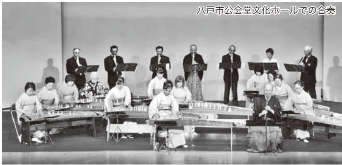
八戸市公会堂文化ホールでの合奏