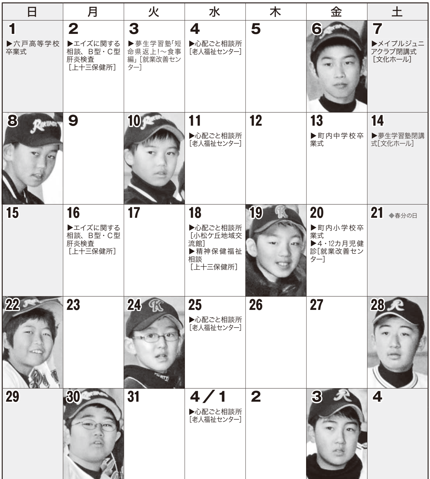
[今月の写真：六戸町スポーツ少年団野球教室]