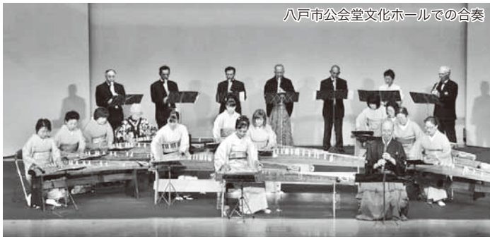
八戸市公会堂文化ホールでの合奏