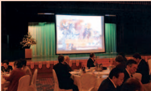
60周年記念映像の上映