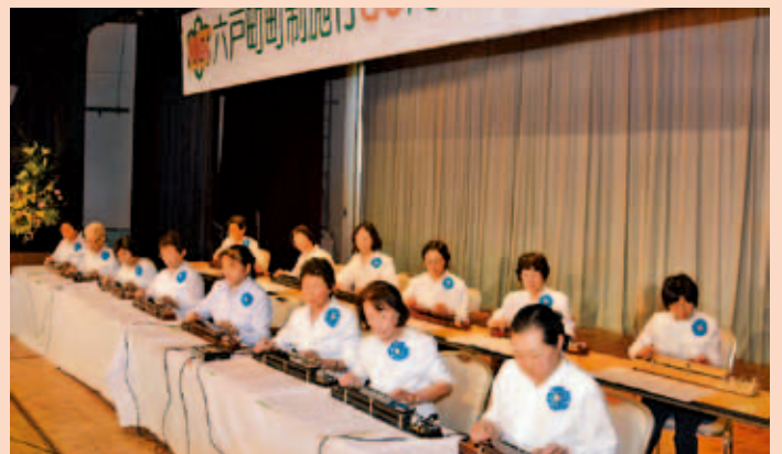
「ろくのへ大正琴の会」による大正琴演奏