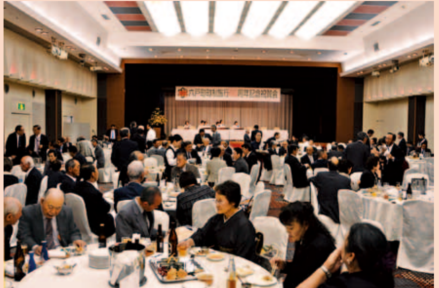
60周年を祝う参加者

記念映像は、町ホームページから視聴(動画サイトへリンク)できるほか、役場ロビーでも見ることができます。また、DVDの貸し出しも行っておりますので、貸し出しを希望される方は総務課へご連絡ください。 総務課 ☎55-4582