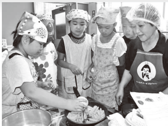
じゃがいものんにくバター炒めを調理する児童たち