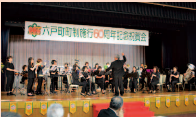
「クレールウィンドオーケストラ」によるオーケストラ演奏