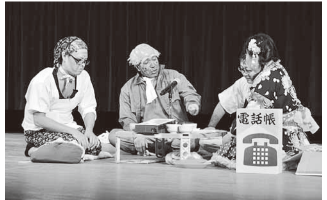
じゅんちゃん一座による寸劇