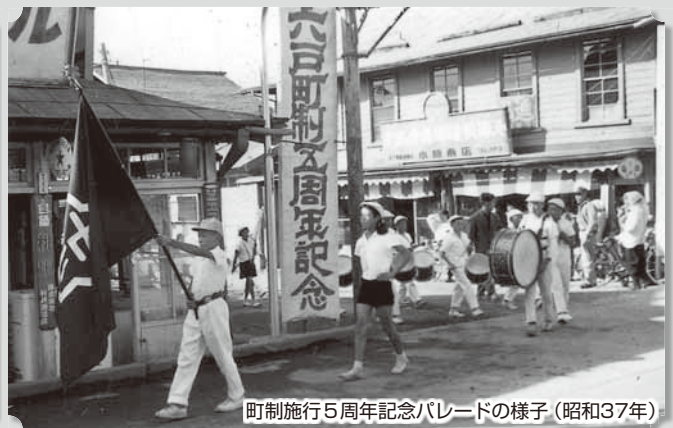
町制施行5周年記念パレードの様子(昭和37年)