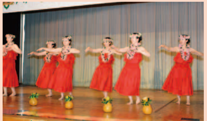
「フィオカマレイ オハイアライ フラストジオ」によるフラダンス披露