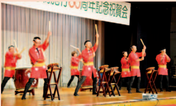
「囃子やー」による太鼓演奏