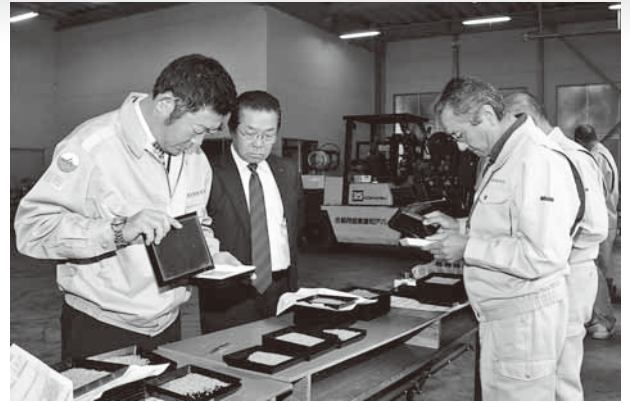
検査状況を見守る沖澤組合長

検査を行った農産物検査員は「低温長雨の被害が想定されたものの、全て1等米となり良かった」と評価していました。