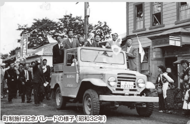
町制施行記念パレードの様子(昭和32年)