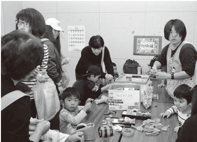
ペットボトル砲作り体験コーナー

式典後は、福祉関係者や来場者によるバルーンリリースで社協まつりがスタート。町内福祉団体やボランティア団体などによる出店や体験コーナーが設けられた。また舞台では踊り、舞踊ショーのほか特殊詐欺に関する講演会や寸劇などのステージ発表が行われ、訪れた来場者を楽しませた。