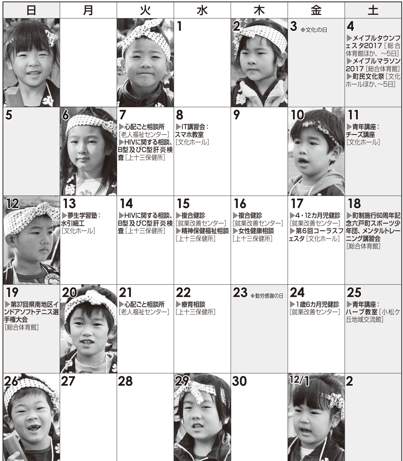
[今月の写真：防火広報パレード]