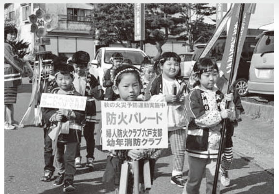
拍子木を鳴らし火災予防を呼び掛ける園児たち

秋の火災予防運動の一環として、十和田地区婦人防火クラブ連絡協議会六戸支部と六戸消防署管内幼年消防クラブ（さつき保育園、こども園えがお、ひのでこども園、第二日の出保育園幼年消防クラブ）、消防署員など95人が参加して防火広報パレードが行われました。開始セレモニーでは、園児代表8人が「先生の教えを守り、火遊びをしません」と『おやくそく』を読み上げ、その後は、拍子木を鳴らしながらパレードし、道の駅などで啓発グッズを配布して、火災予防を呼び掛けました。