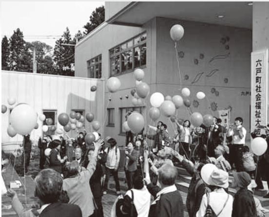
社協まつりオープニングセレモニー「バルーンリリース」