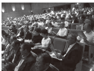
フォーラム会場の様子