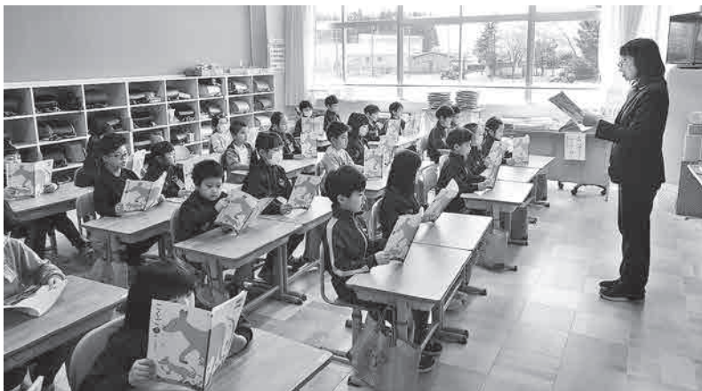
新校舎で学ぶ児童たち