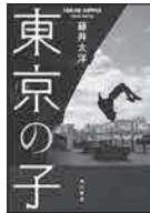
「東京の子」 藤井 太洋