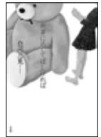
「無事に返してほしければ」 白河 三鬼