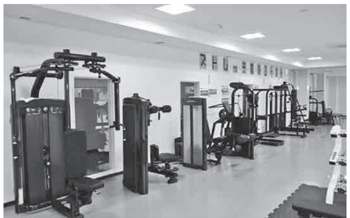
体をほぐせるストレッチ機器コーナー