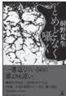
「とめどなく囁く」 桐野 夏生