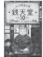
「ふしぎ駄菓子屋 銭天堂 10」 銭天堂 10 廣嶋 玲子