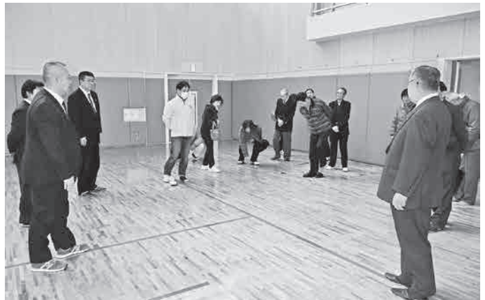
床に触れて暖かさを確認する参加者

トレーニングルームでは、早速高校生が最新の機器で汗を流していました。ストレッチ機器コーナーが設置され可動域を広げるマシンが仲間入り。腰痛や四十肩、五十肩の肩関節周囲炎の緩和の効果があります。