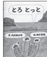
「とろとつと」 内田 麟太郎 西村 繁男