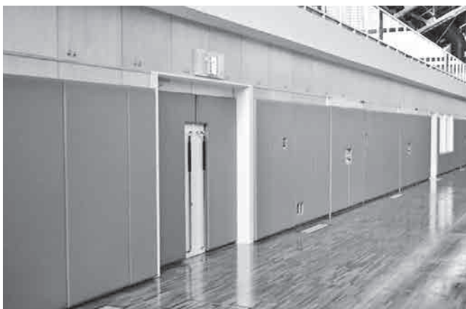
壁にぶつかってもクッションが守ります