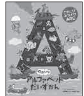
「ゆかいなアルファベットだいちずかん」 アラン・サンダース