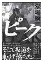
◆ピーク 堂場 瞬一