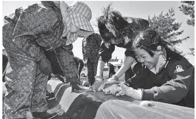
楽しく会話をしながら植え付け作業