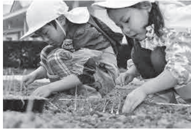
玉ねぎの植え付け体験