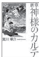
◆新章 神様のカルテ 夏川 草介