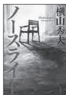
◆ノースライト 横山 秀夫