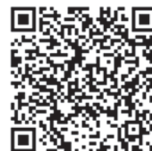
(スマートフォン版)

問 県土整備部 河川砂防課 企画・防災グループ 上北地域県民局地域整備部 河川砂防施設課