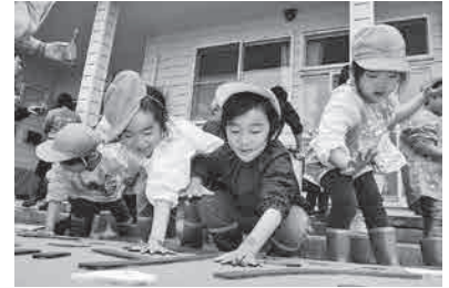
看板に手形を付ける園児