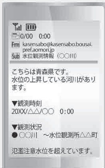
(お知らせメール【一例】)