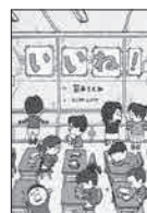
◆いいね! 筒井 ともみ ヨシタケシンスケ