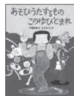
◆あそびうたするもの このゆびとまれ 中脇初枝 ひろせべに