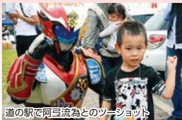
道の駅で阿豆流為とのツーショット