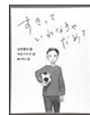
「すきっていわなきやだめ?」 辻村 深月