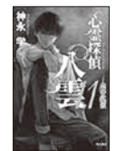
「心霊探偵八雲11」 神永 学