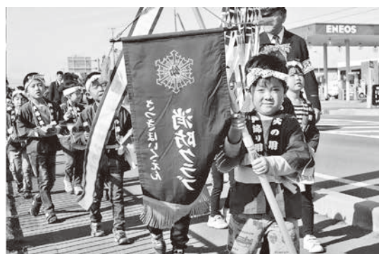
拍子木を打ちながら「火の用心」