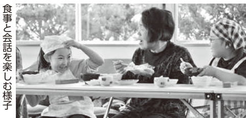
食事と会話を楽しむ様子