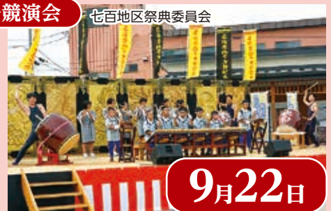
七百地区祭典委員会