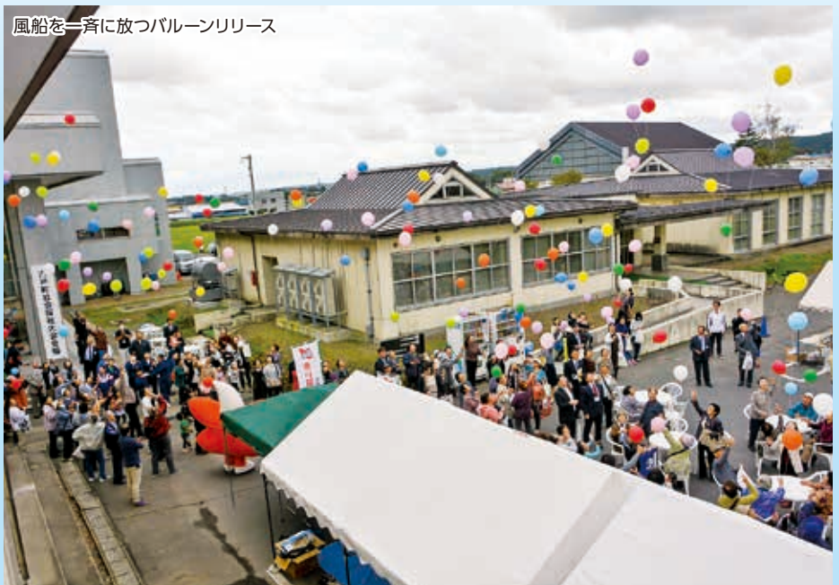
風船を一斉に放つバルーンリリース

会場では、ダンスや歌などのステージ発表や出店なども並び、来場者で賑わいを見せました。