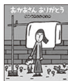
「おかあさんありがとう」 みやにし たつや