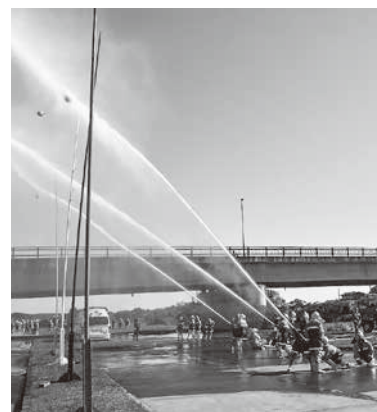
玉落し競技で放水技術を磨く消防団