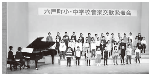
練習の成果を披露する児童たち

町内の小・中学校の児童生徒が一堂に会し、音楽によって交流を深める第31回六戸町小・中学校音楽交歓発表会が文化ホールで開催されました。各学校による合唱や合奏・斉唱そして吹奏楽と合計223名が発表をしました。閉会式では、全員で「六戸町民歌」を合唱し交流を深めました。