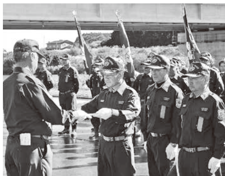
表彰を受ける第六分団古里分団長