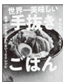
「世界一美味しい手抜きごはん」 はらぺこ 그리스リー