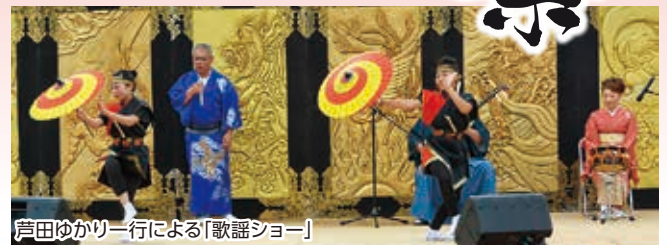
芦田ゆかり一行による「歌謡ショー」