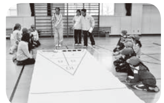
気軽に楽しめるスポーツの普及活動 軽スポーツ教室

■応募方法 履歴書(市販のものに写真添付)を六戸町総合体育館へ 郵送または直接持参により提出してください。