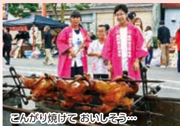
こんがり焼けて おいしいぞ〜