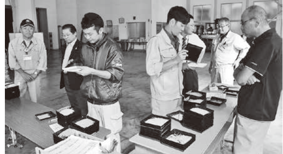
真剣な眼差しで作業をする検査員

町内産の「まっしぐら」の形質や整粒歩合、保有水分のほか、被害粒の程度をチェックし、初検査米2034袋すべて一等米と格付けされました。