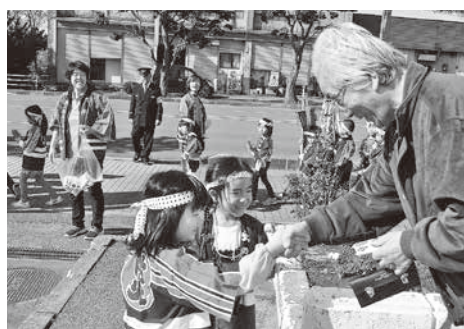
ティッシュを配りながら火災予防を呼びかける児童

10月21日、十和田地区婦人防火クラブ連絡協議会六戸支部と六戸消防署管内の幼年消防クラブ合同の防火広報パレードが行われました。パレードでは拍子木を打ちながら「火の用心、マッチ一本火事のもと」と掛け声をかけながら火災予防を呼びかけました。