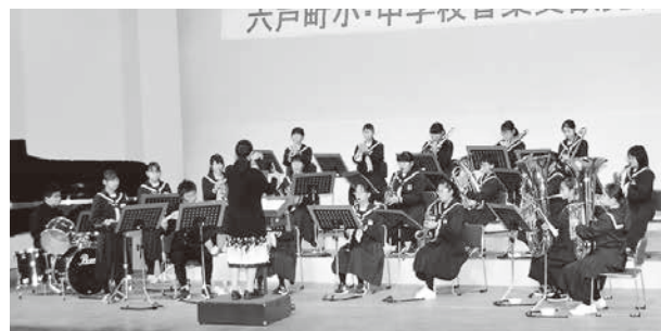
息の合った演奏をする生徒たち