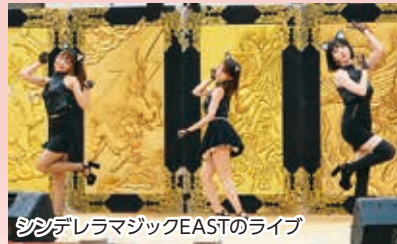
シンデレラマジックEASTのライブ