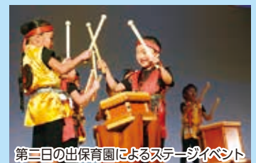
第二日の出保育園によるステージイベント