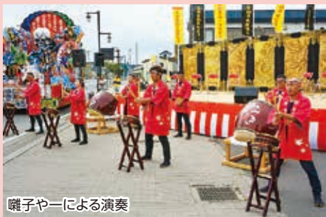
囃子やーによる演奏