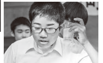
南極の氷を入れた水に耳を傾げる生徒(炭酸のような音が鳴ります)