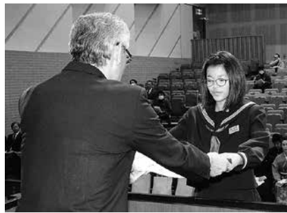
スポーツ賞受賞者