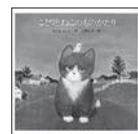
こよりとねこのものがたり なかえ よし