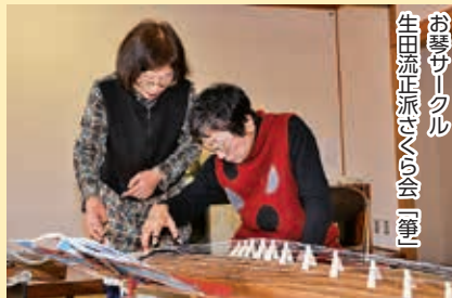
お祭りクル 生田流正派さくら会「筆」