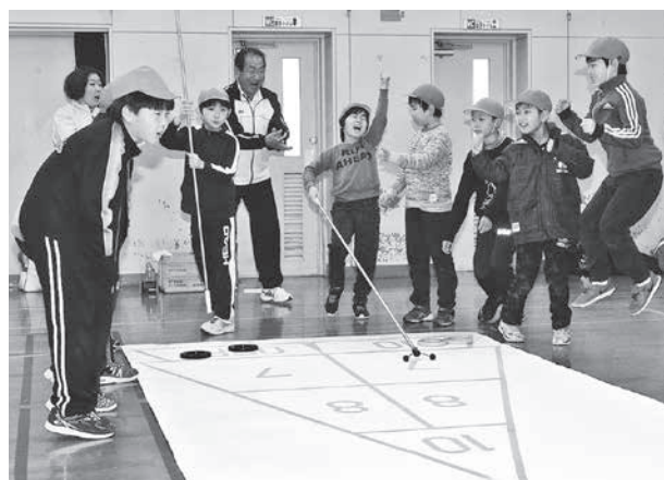
シャッフルボードでナイスショットを決めた児童