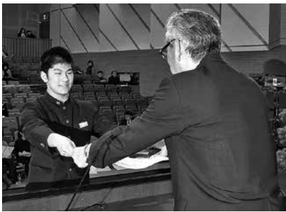
優秀選手賞受賞者