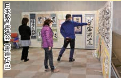
日本教育書道会「書道作品」