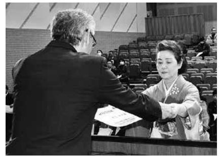
文化功労賞受賞者