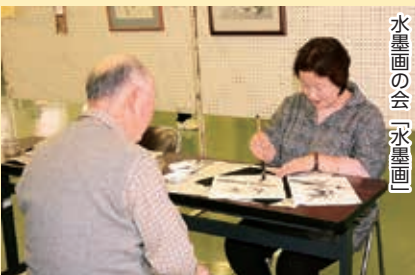
水墨画の会「水墨画」