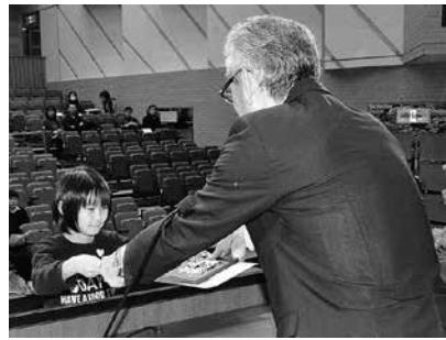
文化功労賞受賞者