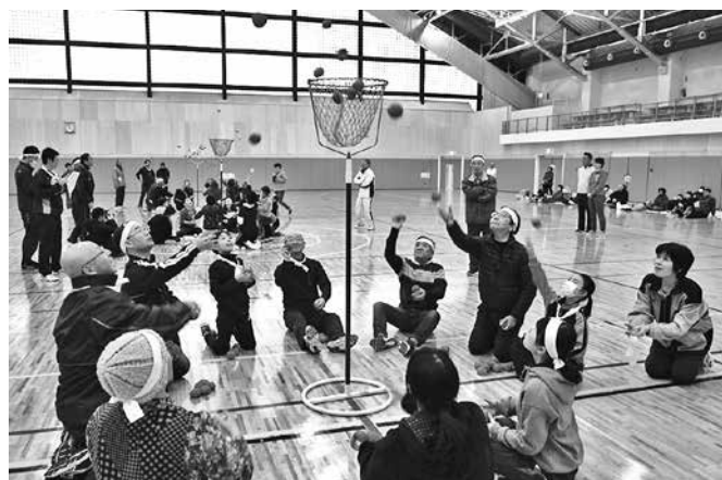
玉入れ競技で白熱する選手