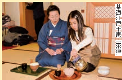
茶道江戸千家「茶道」