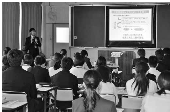
選挙制度について受講する生徒