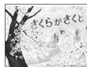
さくらがさくと とうごう なりさ