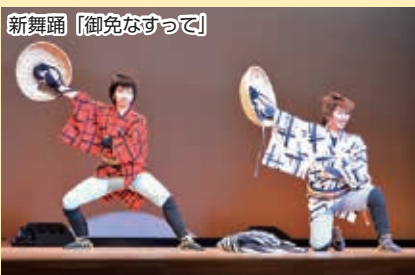
新舞踊【御免なすって】