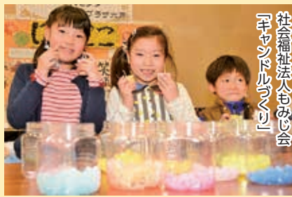
社会福祉法人もみじ会「キャンドル作り」