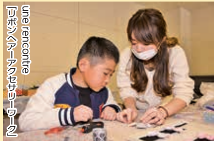
une rencontre 可憐なアンパンマンはじまり