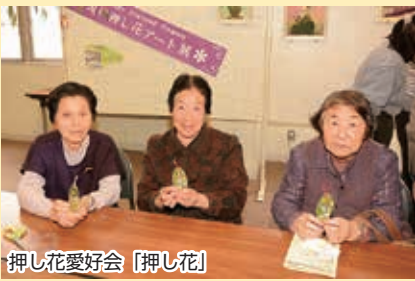
押し花愛好会「押し花」

2月22日、ろくのへ生涯学習フェスタ2020(町教育委員会主催)が文化ホールと就業改善センターで開催されました。各種体験コーナーでは、茶道や押し花体験、水墨画、華道、キャンドル作りなど様々なコーナーが設けられ約100名が参加しました。