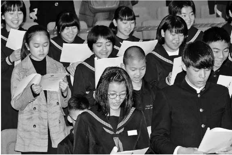
町民憲章を唱和する受賞者