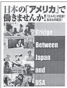
図 エルモ三沢支部管理課 (担当施設…三沢飛行場・八戸貯油施設・車力通信所)