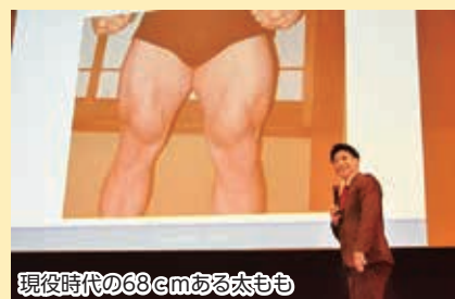
現役時代の63cmある太もも