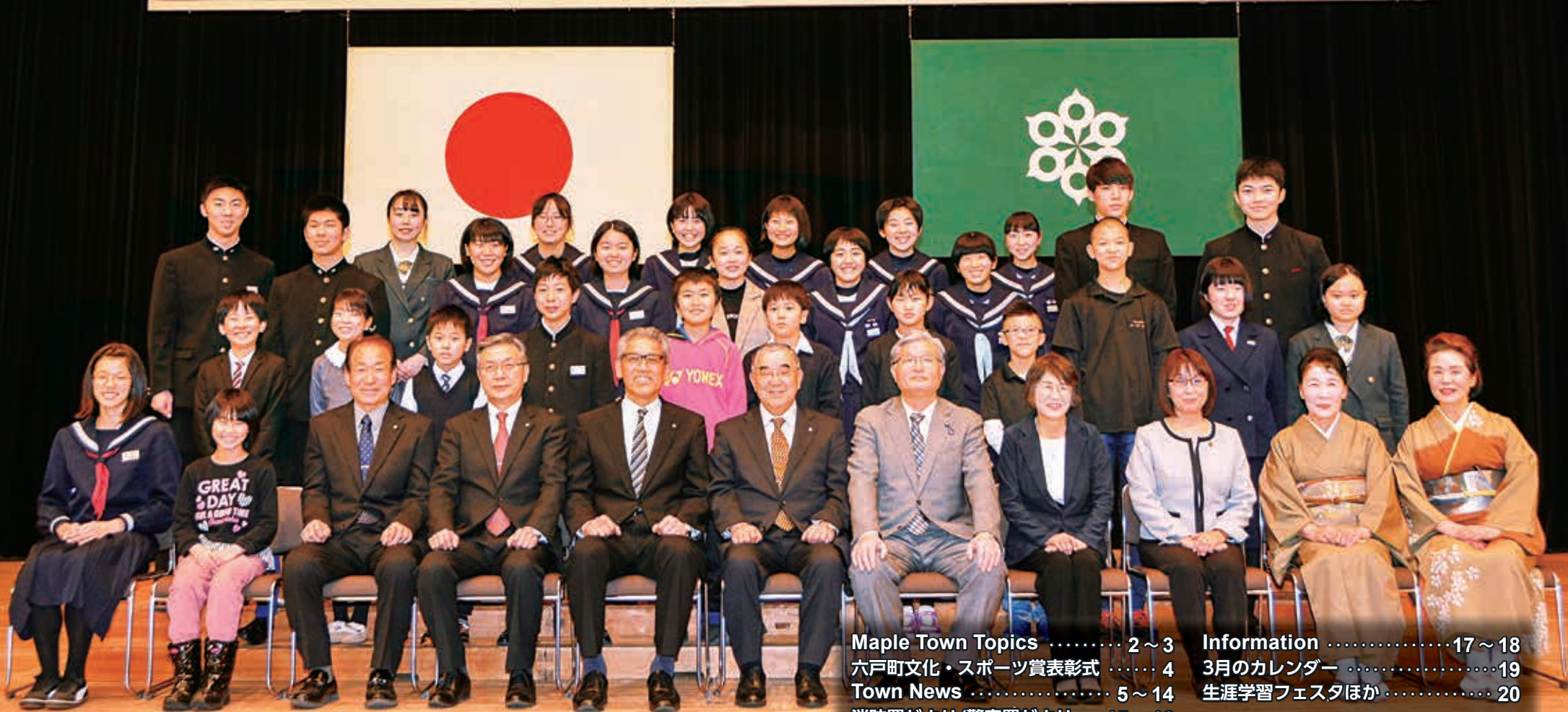
六戸町文化・スポーツ賞表彰式(関連記事は4ページ)