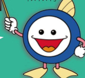
下水道マスコットキャラクター「スイスイ」