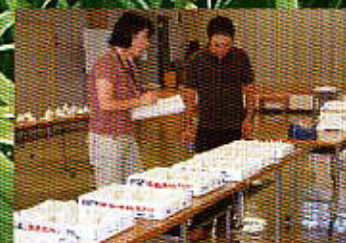
にんにく大玉共励会の審査