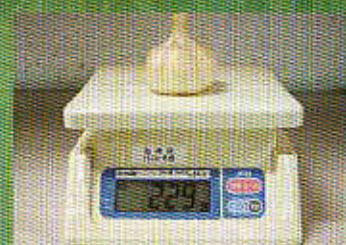
大玉にんにくの計量