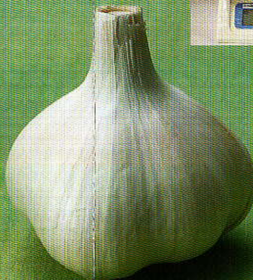
一般的なにんにく(実物大)