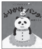
パンダのおさじとふりかけパンダ 柴田ケイコ