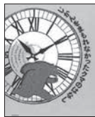
じかんをまもれなかったクマのはなし ジャン=リュック・フロマンタル