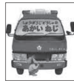
しょうぼうじどうしゃのあかいねじ たるいし まこ