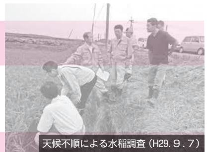
天候不順による水稻調査(H29. 9. 7)