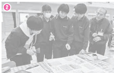
② グループで一つのオリジナル新聞を作ります。新聞のタイトル、一面記事、見出しは…？ みんなで話し合って作っていきます。