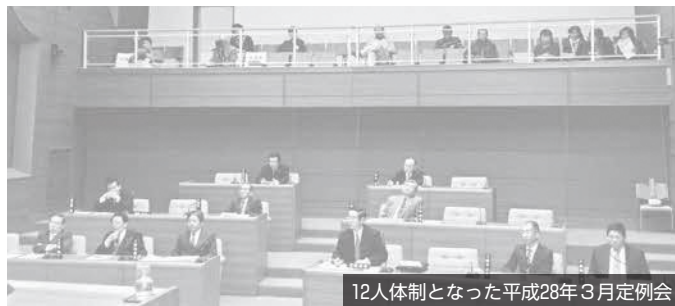
12人体制となった平成28年3月定例会