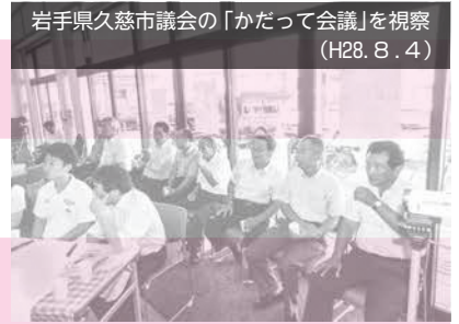
岩手県久慈市議会の「かだつて会議」を視察 (H28. 8. 4)