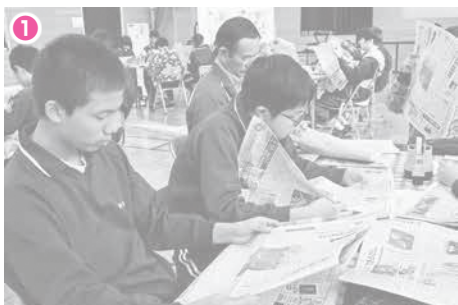
① 新聞を熟読し、自分が興味のある記事を2つ選びます。宣伝広告やコラム、天気予報もOKです。