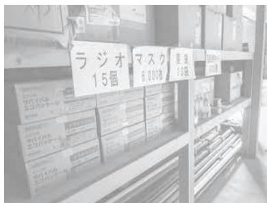
防災倉庫にある非常食と備蓄物

町内8ヶ所の避 難所、各消防団屯 所・役場に合計25台を配 備しております。各施設 の管理者・責任者には、 定期的な点検をお願いし ており、点検をした際、 不具合があれば、その都 度修繕等の対応をしてお ります。