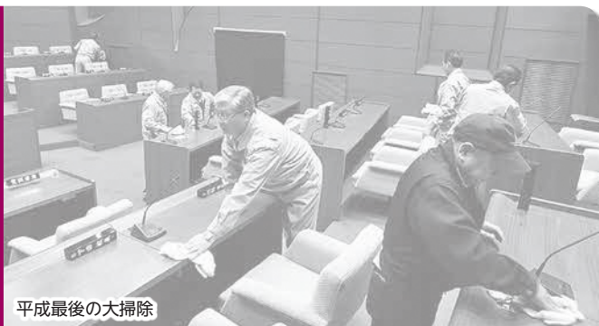
平成最後の大掃除

12月25日、年末恒例の大掃除を行いました。議場や議員控室、議長室などを、ぞうきんや掃除機を使い、議員全員で感謝の気持ちを込め、平成30年を締めくくりました。