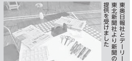
東奥日報社とデーリー東北新聞社より新聞の提供を受けました

興味のある新聞記事を切り抜き、討論しながらオリジナルの壁新聞を作るワークショップの一種です。新聞という共通の話題を共有することにより、多様な意見を聞くことができます。