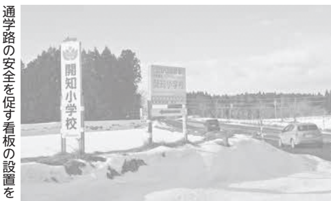
通学路の安全を促す看板の設置を

*他に、七百中学校未舗装部分の舗装化及び労働者体育センターへの入口を広くできないかの質問と、開知小学校未舗装部分の舗装ができないか質問をしました。