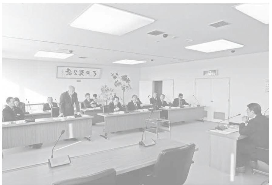
議員全員で一般質問を検証

議会議員全員協議会で話し合われたことを元に、六戸町議会は町側へ回答を求める予定です。詳しい内容は、次号以降の議会だよりでお知らせします。 六戸町議会は、町政の情報公開と町の皆さんの