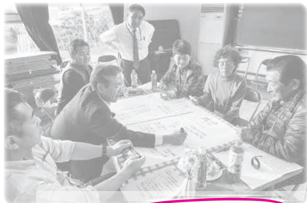
思い思いの色のマジックを手に

六戸町議会は、11月18日に七百地区公民館で意見交換会を行いました。今回は、小松ヶ丘地区を除く七百中学校学区にお住まいの23人の皆さんです。