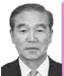
こうさか しげる 高坂 茂 議員