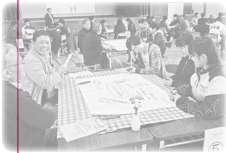
みんなの地元「六戸」のことを話そう！

挑戦する人の後押し（お金、情報、ノウハウ、人的ネットワーク）／人や施設の設備等周りの環境づくり／夢に近づくための情報・手段の提供