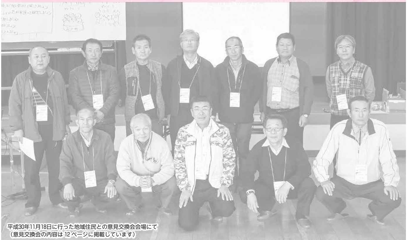
平成30年11月18日に行った地域住民との意見交換会会場にて (意見交換会の内容は12ページに掲載しています)