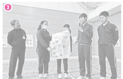
③ 壁新聞が出来上がったら、全員で投票。上位3グループが全員の前で発表しました。