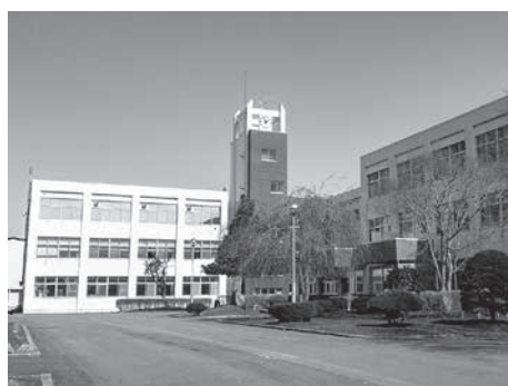
令和5年3月閉校となる六戸高等学校

思われますが、補助金は文科省、地方債は総務省系列とかありますが、補助金と同じ時期に申請し、その後、町の方に借入という形で資金が届いてくるといふ流れです。