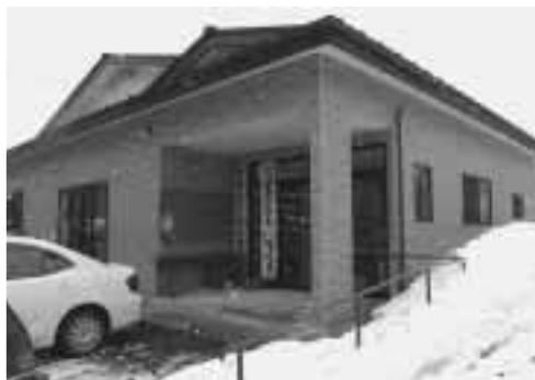
▲完成した沖山ふれあい館

平成16年9月下旬から着工していましたが、「沖山ふれあい館」がこの度完成し、3月13日に同館にて落成式が行われました。