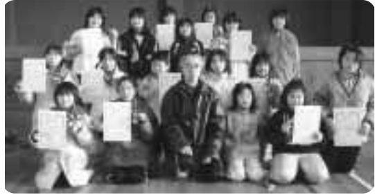
▲各ブロックで入賞した選手ら

3月6日、六戸町総合体育館において、平成16年度六戸町スポーツ少年団卓球大会が行われました。この日は、30名の児童が参加。