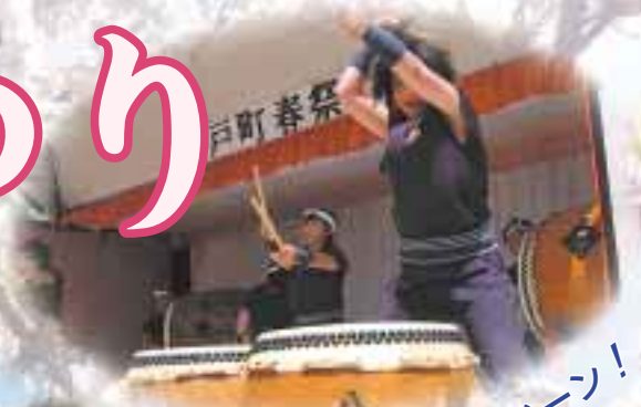
▲八甲田太鼓だドーン！