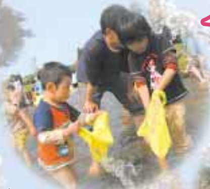
◀うまかつかめたかな？ (魚つかみどり大会)