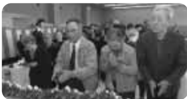
▲献花をする遺族ら