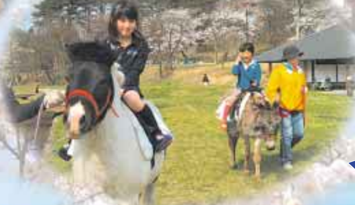
◀ポニーの背中は 気持ちいい～！