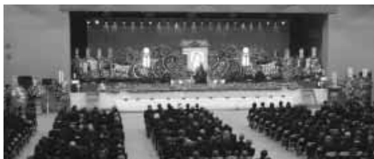
▲会場をうめた参列者

しまなかつた故人をしのび、体育館を埋め尽くすたくさんの人々が弔問に訪れました。 故人の数々の業績に敬意を表し、心からご冥福をお祈りいたします。