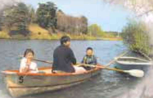
◀晴天で ボートも 大繁盛！！