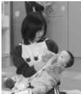
▲上手に授乳できました!!

この体験学習は、思春期の生徒たちに乳幼児の成長や育児の喜びと大変さを知ってもらおうと毎年行われています。