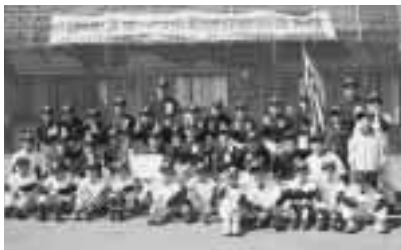
▲優勝した六戸スポーツ少年団

5月21日、第26回六戸町スポーツ少年団交歓軟式野球大会がメイプルスタジアムにおいて開催されました。大会には町内の4チームが参加し熱戦が繰り広げられ、六戸スポーツ少年団が優勝しました。結果は次のとおり。