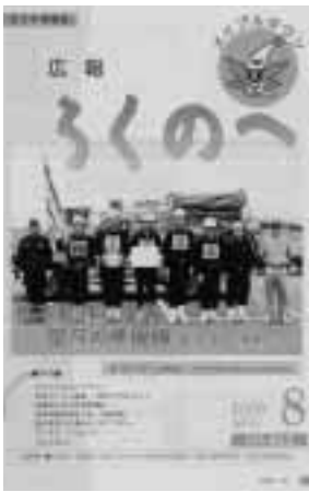
第1回が掲載された「広報ろくのへ」(平成12年8月号)