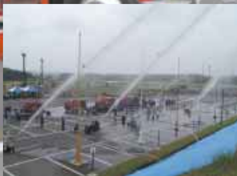
日頃の成果を競う玉落とし競技