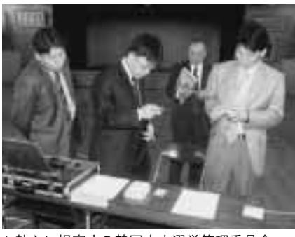
▲熱心に視察する韓国中央選挙管理委員会

有権者数 8、852人 投票者数 7、366人 投票率 83.21% 有効投票数 7、290票 無効投票数 4票 電磁的記録式投票機の操作を途中で終了した者の数 71 持ち帰り票 1