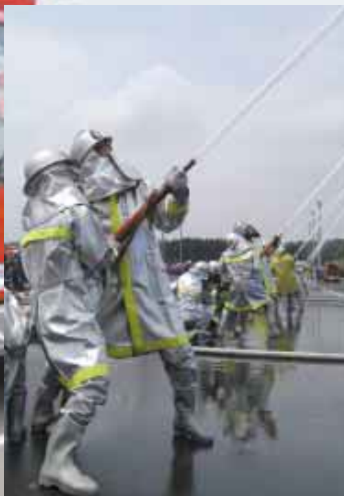
狙うは1位、放水はじめー!