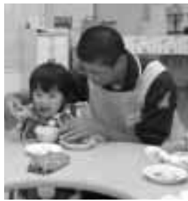
▲お兄さん、お姉さん子供達も大喜び!

当日は、生徒1名に対し乳幼児1名の面倒を見ようという設定で、生徒たちは元氣一杯の子供たちに戸惑いながらも一生懸命お世話していました。