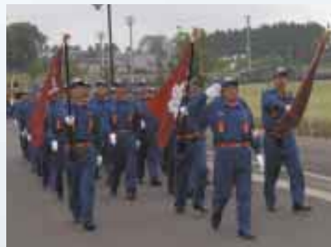
堂々の行進を披露する六戸町消防団員