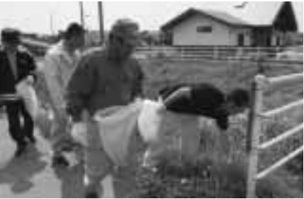
▶町のために奉仕活動

町では「耕作組合の青年部と女性部による清掃活動が6月1日、メイプルふれあいセンター周辺にて行われました。これは6月1日の「たばこの日」にちなんで行われたもので、組合員らは約2時間かけてゴミを回収。道路沿いに捨てられたゴミの多さに驚きながら空き缶などを拾い集めていました。