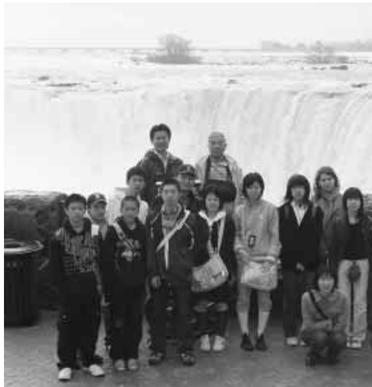
▲ナイアガラの滝の前で記念撮影

僕が海外派遣で最初に感じたことは、食文化でした。僕がいたホストファミリーの家では、朝はシリアルやトーストなどの軽い物と牛乳という組み合わせで、夕食はロフスターがメインならロフスター1品だけの食事でした。しかし日本では、基本