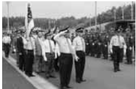
▶整然と整列した団員を観閲

式典では、消防功労者の表彰が行われたほか、町内の幼年消防クラブによるアトラクションも披露され、式典に花を添えました。