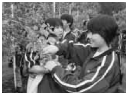
▲慣れない作業にも楽しそうです

りんご村では、秋に収穫した野菜を同中学校に送る予定で、農業体験をした生徒たちは北海道で秋の美を楽しんでいます。