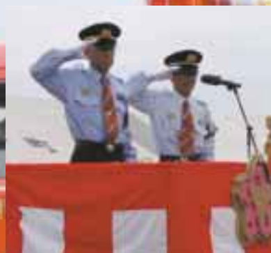
六戸町沼田団長(左)と 下田町袴田団長(右)