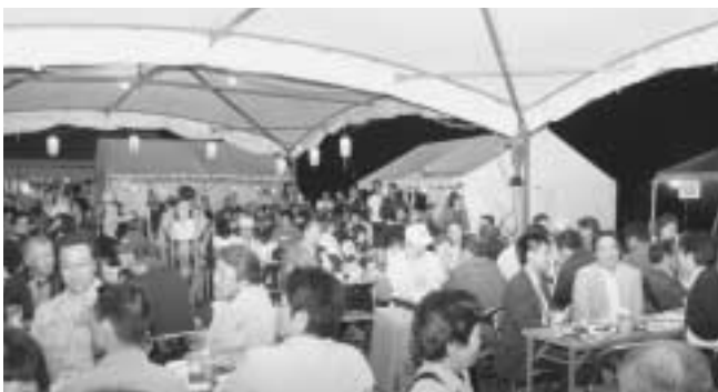
▲たくさんの人で埋め尽くされた会場の様子

7月22日・23日の2日間、メイプルふれあいセンター駐車場にてサマーフェスティバル2005が開催され、多くの市民でにぎわいをみせました。初日はあいにくの肌寒い天候でしたが、2日目は晴天に恵まれ絶好の祭り日和。訪れた人たちは、商工会青年部が用意した「生ビール」で喉を潤しながら、家族や仲間と夏の暑い夜を満喫しました。