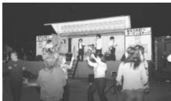
▲バンドも来場者もノリノリです

会場では、六戸町緑化推進委員会からハーブの苗木無料プレゼントやバンド演奏、ビンゴ大会などのイベントが催され、まじりの気分を盛り上げました。毎年恒例のビンゴ大会は、生のうなぎや十三湖産のしじみなどの珍食品も用意され、多くの来場者が楽しいひと時を過ごしました。これからは夏本番。みなさん、安全には気をつけて思い出しに残りつつ楽しい夏を過ごしてください。