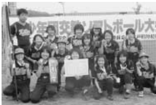
▲優勝した大曲スポーツ少年団