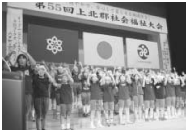
▲素晴らしい手話コーラスを発表した六小4学年

6月25日、第15回六戸町スポーツ少年団ソフトボール大会が町総合運動公園多目的広場において開催されました。当日は天気にも恵まれ、各チームが日頃の練習の成果を發揮しました。