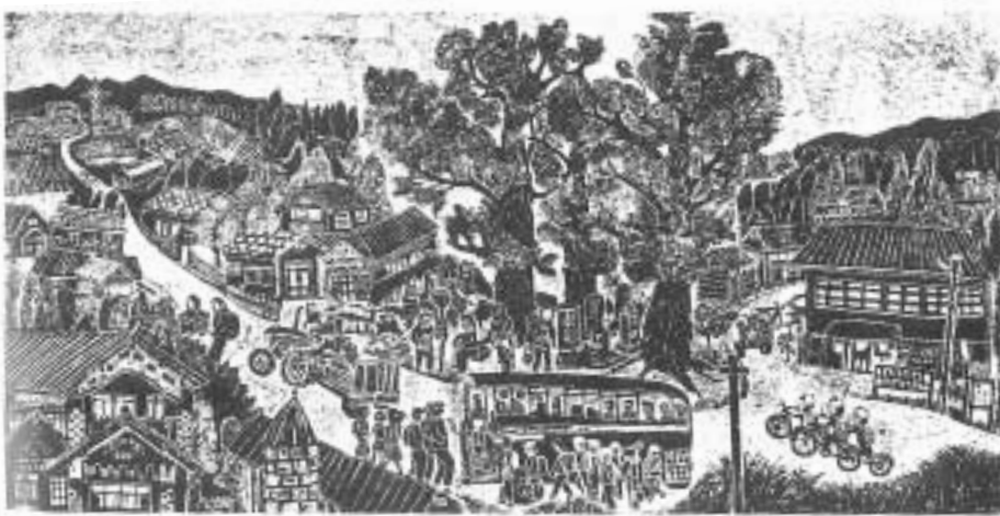
▶「村のバス停・朝7時」