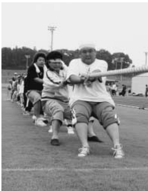
▲3連覇を達成した昭陽チーム

8月7日、町民運動会が総合運動公園陸上競技場で開催されました。当日は天候にも恵まれ、約1,000人の参加者が爽やかな汗を流しました。