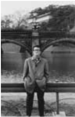
昭和36年3月 二重橋での筆者

♪昔じゃお江戸をお籠籠で馬へ今はスピード定期バスへ故郷(こ)の父(とと)さも母(かか)さも泣いた／うれし涙の二重橋(にじゅうけい)東京よいとこ東京よいとこヨイヨイヨイ