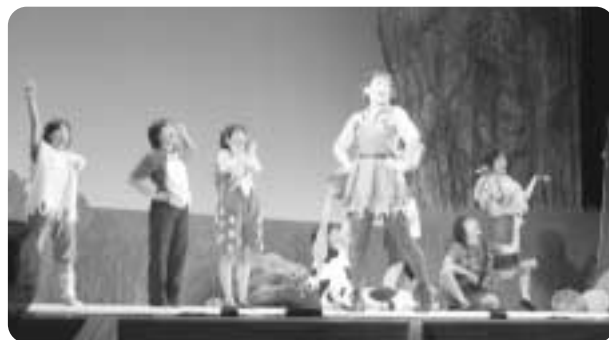
▲観客を魅了したピーター・パン

町文化ホールでこのほど、特定非営利活動法人(NPO法人)「劇団ゆづ」(右手県滝沢村)のミュージカル「ピーター・パン」が上演されました。今回のミュージカルは、昨年の12月に開催した「ピーター・パン・フォーラムin六戸」に続くプロジェクト第2弾となります。ミュージカルには、主人公ピーター・パンをはじめフック船長、ウェンディ、インディアンなどが登場。会場に詰め掛けた親子連れ約400人が、夢の世界・ネバーランドの楽しい歌と踊りを楽しみました。