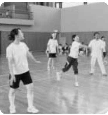
▲スポーツで親睦を深める選手たち