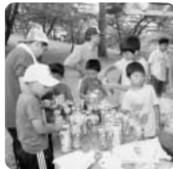
▲夕食の準備をする「戸」の子どもたち

舘野公園で7月29日、30日、「戸」の兄弟のまち交流キャンプ」が行われ、当町と若手県九戸村の小学生がレクリエーションを楽しみながら、交流を深めました。 九戸村とは1994年に「兄弟のまち宣言」をして以来、夏には