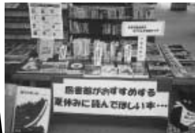
特設コーナーの様子

図書館では、毎月「特設場」を設け、いろいろな情報提供をしています。8月の「夏休みに読んでほしい本」コーナーでは、読書感想文用の絵本や物語がみなさんにも人気がありました。9月は「まつり」に関する本の展示を計画しています。昔のまつりはどうだったんだろうっ。みなさんの来館をお待ちしております。