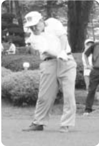
▲“ナイスショット”です

その中で、参加者からの善意で集まった募金合計8万4千6百00円が町社会福祉協議会に寄付されました。