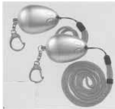
寄贈した防犯ブザー