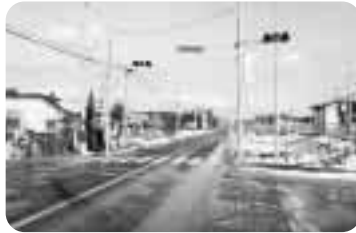
▲新しく設置された信号機

平成17年12月12日、県道十和田・三沢線、十鉄古里駅沿いに押しボタン式信号機が設置され、歩行者が信号機を利用して横断できるようになりました。なお、車が赤信号でも必ず止まることも限りませんので、今後