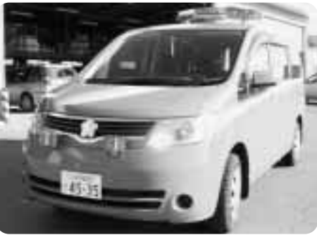
▶サイレン鳴らして出勤します

このほど町消防団指揮車が配備されました。配備された指揮車は、火災や災害時に出勤し、消防団員の指揮をとり、的確に活動を行えるよう現地本部の役割を担います。また、地域の火災予防、災害対策の広報活動も行います。町民の皆さん、真つ赤な指揮車を見ることはあっても、利用することがないよう防火意識を高めましょう。