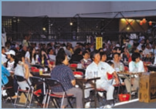
▲ビール天国は満員御礼の大盛況