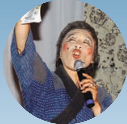
▲ベゴ屋のかっちゃん爆笑ライブ！