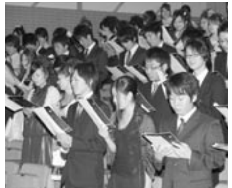
▲町民歌を斉唱する新成人ら