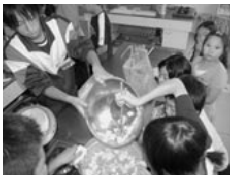
▲みんなで仲よく夕食づくり

「戸」の兄弟のまちとして交流のある六戸町と岩手県九戸村の小学生37人が7月30日、31日に六戸町内で交流キャンプを行いました。 キャンプ当日、天候はいくくの雨模様でしたが、小学生らは天気に負けないくらいの元気を見せて室内でオリエンテーションやゲームを通じてお互いの交流を深めました。 当初の予定では館野公園でテントを設営、宿泊する予定でしたが、宿泊場所を就業改善センターへ変更しました。夕食は六戸町の特産品であるシヤモロックとにんにくをたっぷり使ったカレーライスを子どもたちが作りました。子どもたちをサポートするために六戸中学校の生徒がボランティアスタッフとして奮闘し、おいしい夕食をみんなで楽しみ、一味違った交流キャンプを満喫しました。