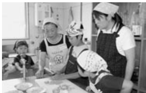
▲左手に気をつけてね！