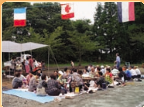
▲万国旗はためく空の下で和やかに

2チームに分かれ、趣向を凝らしたプログラムに、小学生からお年寄りまで仲よくチームワークを競い合いながら爽やかな汗を流し、楽しみました。