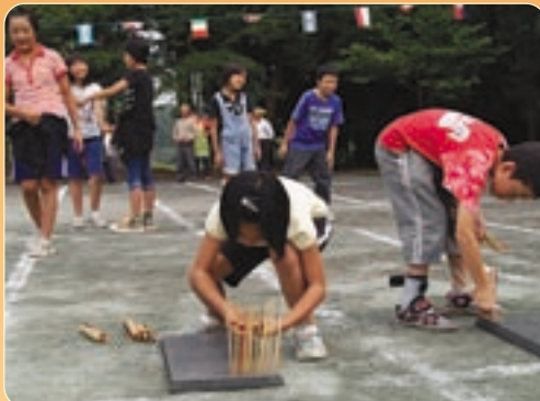
▲竹串を稲の苗に見立てた『田植え競争』どっちが早いかな?