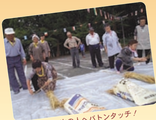
▲縄をなつて次の人へバトンタッチ!