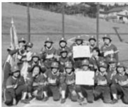
▲2年連続優勝の六戸スポーツ少年団