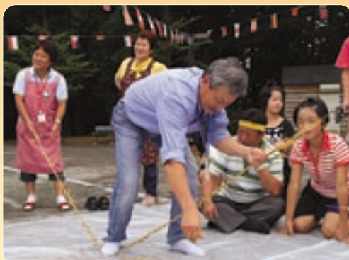
▲『縄なり競争』対抗するチームと接戦でハラハラドキドキ!