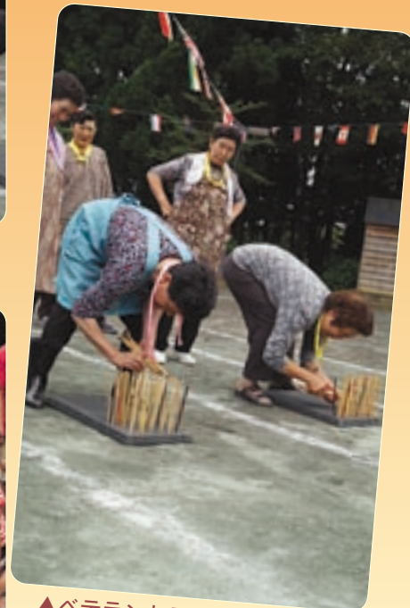
▲ベテランお母さんたちの手元が鮮やか!