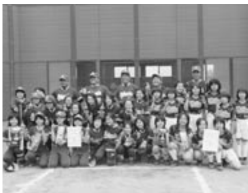
▲「優勝の六戸SS」と「準優勝の大曲SS」揃ってハイポーズ!