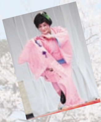
▲六戸町芸能愛好会のステージではファンからの歓声が飛び交っていました。