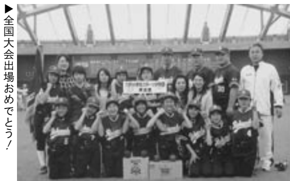
(執筆・写真提供 六戸小スポーツ少年団ソフトボール部)

この度、六戸小学校スポーツ少年団ソフトボール部は宮崎県宮崎市で行われた全国大会に出場しました。WBC日本代表がキャンプ地としたサンマリノスタジアムに隣接された木花ドームで開会式が行われ、選手たちは初々しいチーム行進を行いました。 試合は、前年度優勝の長崎県佐世保ひまわりと対戦し、0対13と負けましたが、日本のトップレベルを目の当たりにして、得るものが大変多かったように思います。この貴重な経験を今後に生かし、更なる飛躍に期待します。 最後に、町民の皆様におかれましては物心両面に渡りご協力いただき、誠にありがとうございました。今後とも温かいご声援、励ましの程よろしくお願ひします。