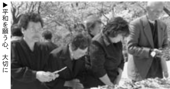
▶平和を願う心、大切に