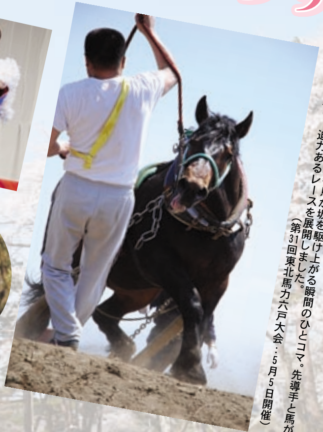
▲そりに重りを載せた競争馬が坂を駆け上がる瞬間のひとコマ。先導手と馬が一体となり、迫力あるレースを展開しました。(第31回東北馬力六戸大会：5月5日開催)