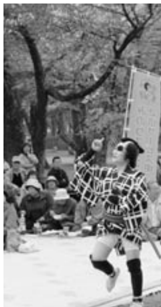
▲これぞお花見の楽しみ方でしょう！