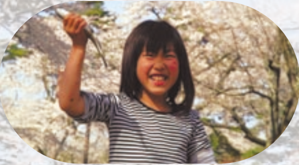
▶「とったーりー!!」 今年の春まつりの目玉イベントの一つ、「魚のつかみどり」で見事魚を捕まえた一瞬のひとコマ。魚のつかみどりに参加したくさんの子どもたちが参加しました。