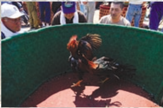
▲一撃必殺! 軍鶏同士の息詰まる熱戦に観客たちも大興奮 (第50回北奥羽軍鶏闘技大会：5月5日開催)