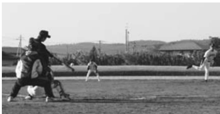
▲ホームランを目指せ～!!

これがレオンのメールアドレスです ↓メールをくれたら必ず返事します♪ fonseka_leon@town.rokunohe.aomori.jp