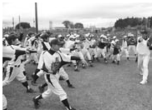
▲野球教室で巨人軍OBの指導を受ける熱心な姿の球児たち

5月23日、24日に六戸町総合運動公園メイプルスタジアムで第一回ジャイアンツ杯青森県中学野球大会が行われ、県内の中体連地区代表10チームが参加し熱戦を繰り広げ、弘前二中が優勝を手にしました。