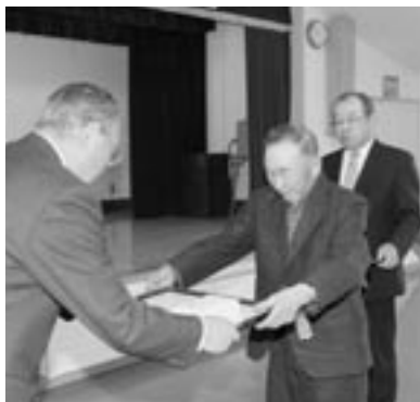
▲川村富夫連合会長による表彰を受けた方々