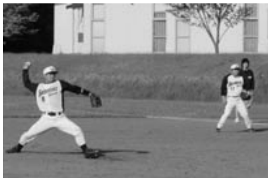
▲打てるもんなら、打ってみろ!!

ら6月下旬にかけて、月曜日から金曜日まで、毎日町営野球場で試合をしています。選抜戦が終わったら上位の4チームが決勝リーグをやって、残った1位と2位が六戸代表として青森県朝野球選手権大会に進みます。 忙しい中で貴重な寝る時間を犠牲にしてまで「野球が好き！」という事から、地域交流の一環と健康促進でもある朝野球は素晴らしいです。試合開始は午前5時半で、7時までに終了させています。興味がある方はぜひ見に来てくださー！