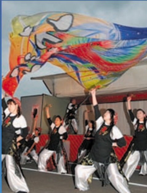
▲よさこいチーム「だんぼう」のステージ。チームの目玉である大旗が出た瞬間、周りから歓声があがった。