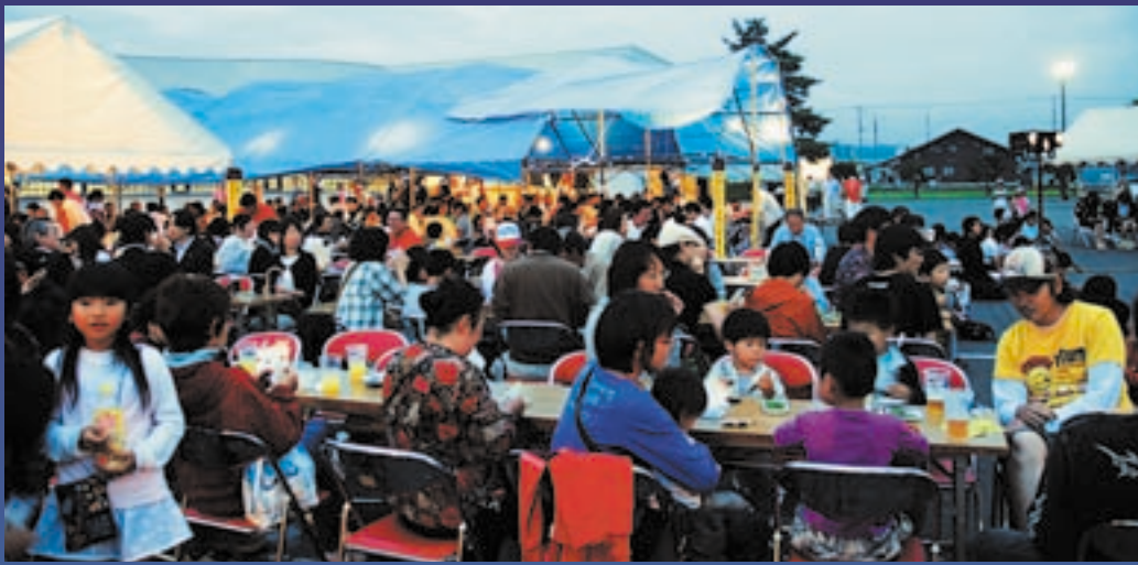
▲日暮れとともに盛り上がる会場内。生ビール天国のビールがおいしそう！