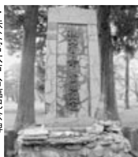
▲秩父宮六戸台臨記念碑 館野公園内

会員の皆さまにおかれましては、秋の一日のバスツアー、ぜひともたくさんの方々にご参加いただきたいと思います。