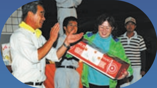
ビンゴゲーム大会の様子。お楽しみの景品が並び、カードを手にした参加者の熱い視線が会場を盛り上げた。