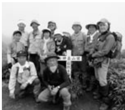
▲自力で頂上に登った気持ちは一度確認すべきです！

登山愛好会の活動というと、年に、4回の登山を行っています。もうちょっと登りたいという人に、特別の『宿