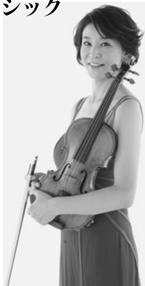
■演奏者 高嶋ちさ子[ヴァイオリン]

11月には「高嶋ちさ子の名曲案内~心が10倍豊になるクラシック」(PHP新書)を発売。