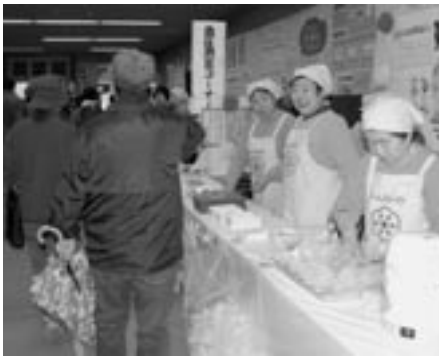
▶メイプルタウンフェスタでは健康的でバランスのとれたレシピを紹介しています